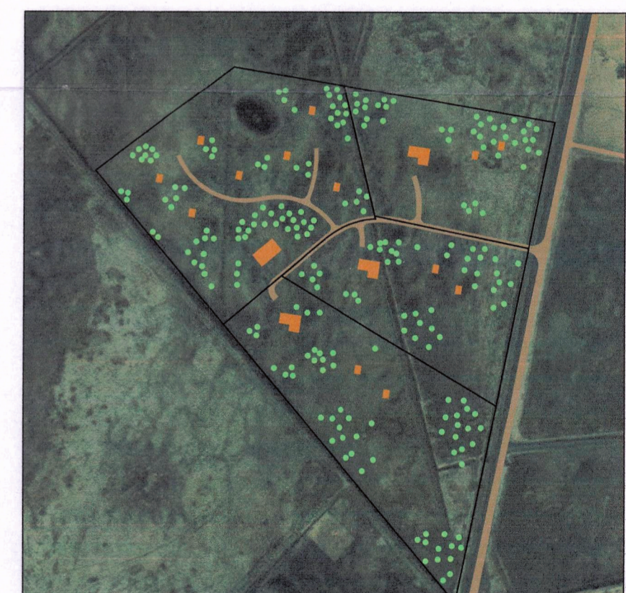
Skýringamynd með gildandi deiliskipulagi aðliggjandi lóða ásamt drögum að skipulagi svæðis fyrir gistuhús og ferðaþjónustu

Aðalskipulagsbreyting þessi sem auglýst hefur verið samkvæmt 36. gr. skipulagslaga nr. 123/2010, með síðari breytingum, var samþykkt af sveitastjórn Flóahrepps þann 26. 6. 2023