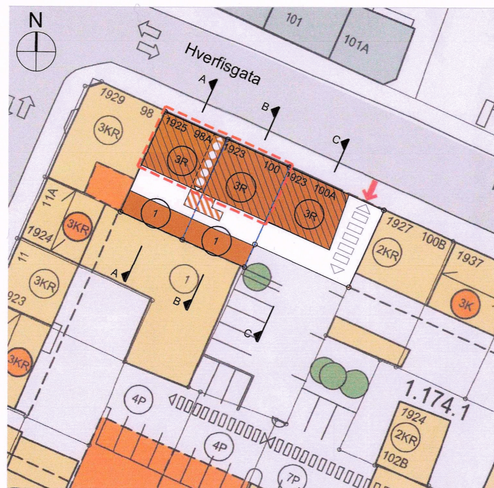
TILLAGA AÐ BREYTTU DEILISKIPULAGI LÓÐIRNAR HVERFISGATA 98A, 100 OG 100A M 1 : 500