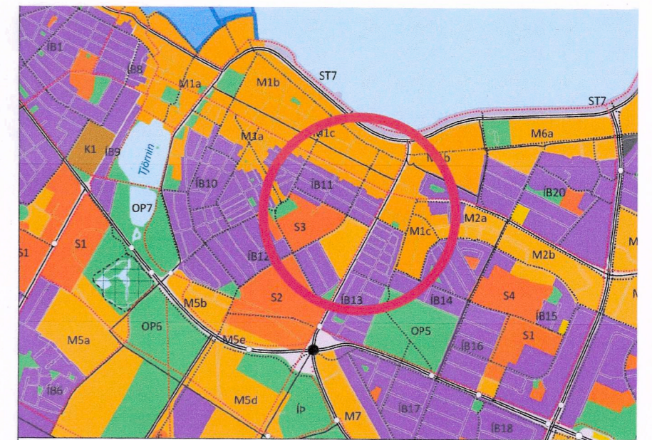
HLUTI AF ADALSKIPULAGI REYKJAVÍKUR 2040