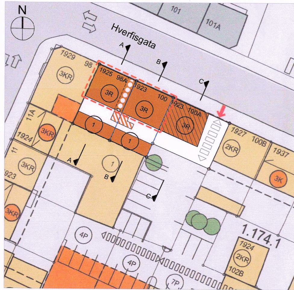
GILDANDI DEILISKIPULAG LÓÐIRNAR HVERFISGATA 98A, 100 OG 100A Staðfest 20. janúar 2022 M 1 : 500