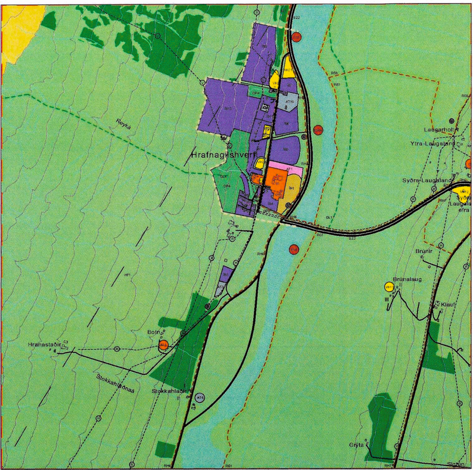
GILDANDI AÐALSKIPULAG M.S.BR. SÉRUPPDRÁTTUR: NORÐURHLUTI-BYGGÐ OG BYGGÐAKJARNAR 1:15.000