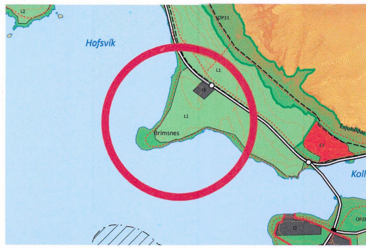
Hluti gildandi Aðalskipulags Reykjavíkur 2040