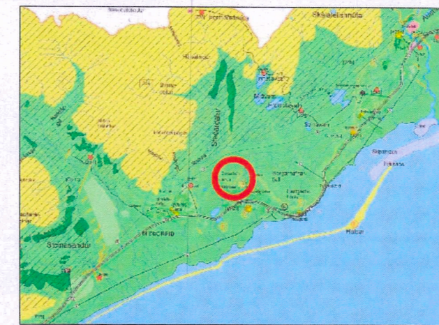
Hluti af sveitarfélagsupprætti Aðalskipulags Hornafjarðar 2012-2030