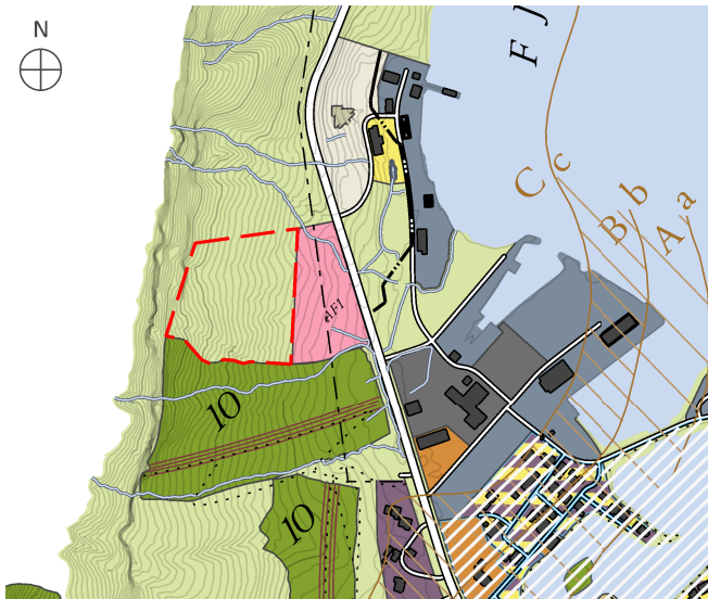
GILDANDI UPPDRÁTTUR 1:10.000