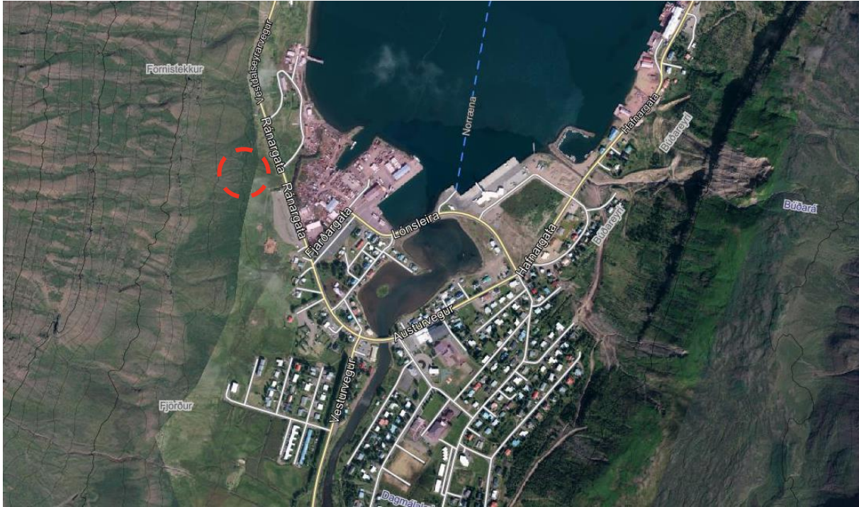
Mynd 1. Fyrirhuguð staðsetning á varnarkeilum er sýnd með rauðum hring.