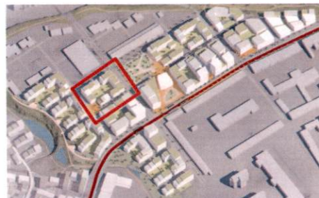
Ártúnshöfði svæði 1: Yfirlitsmynd