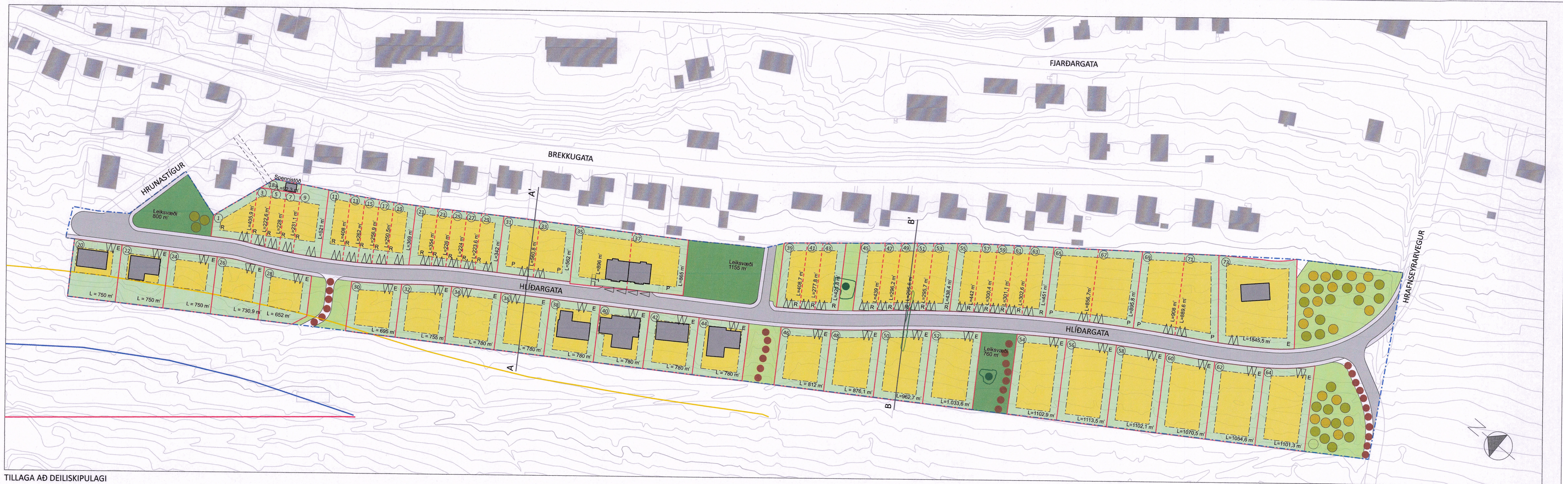
TILLAGA AÐ DEILISKIPULAGI