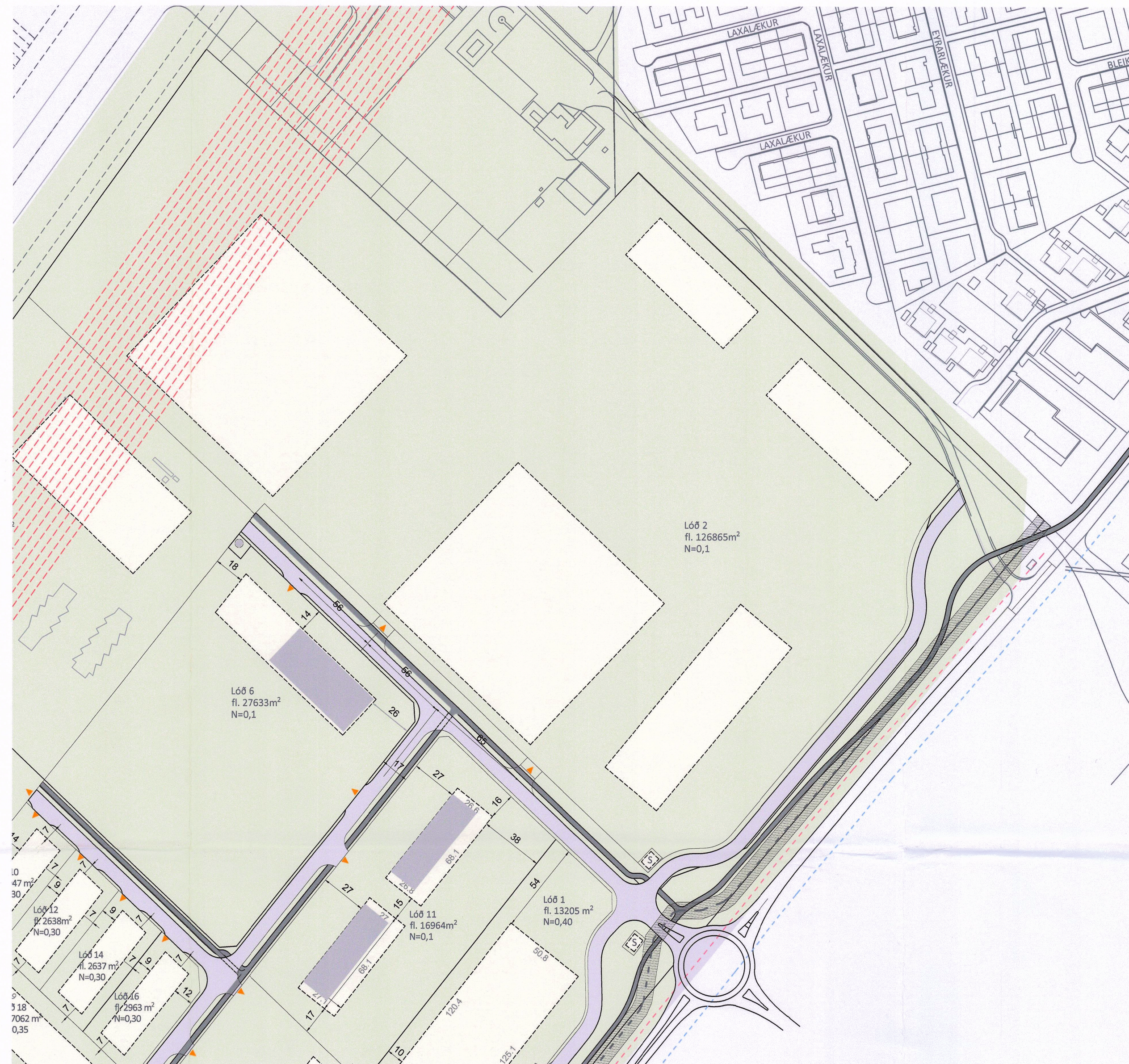
BREYTING Á DEILISKIPULAGI 1:2000