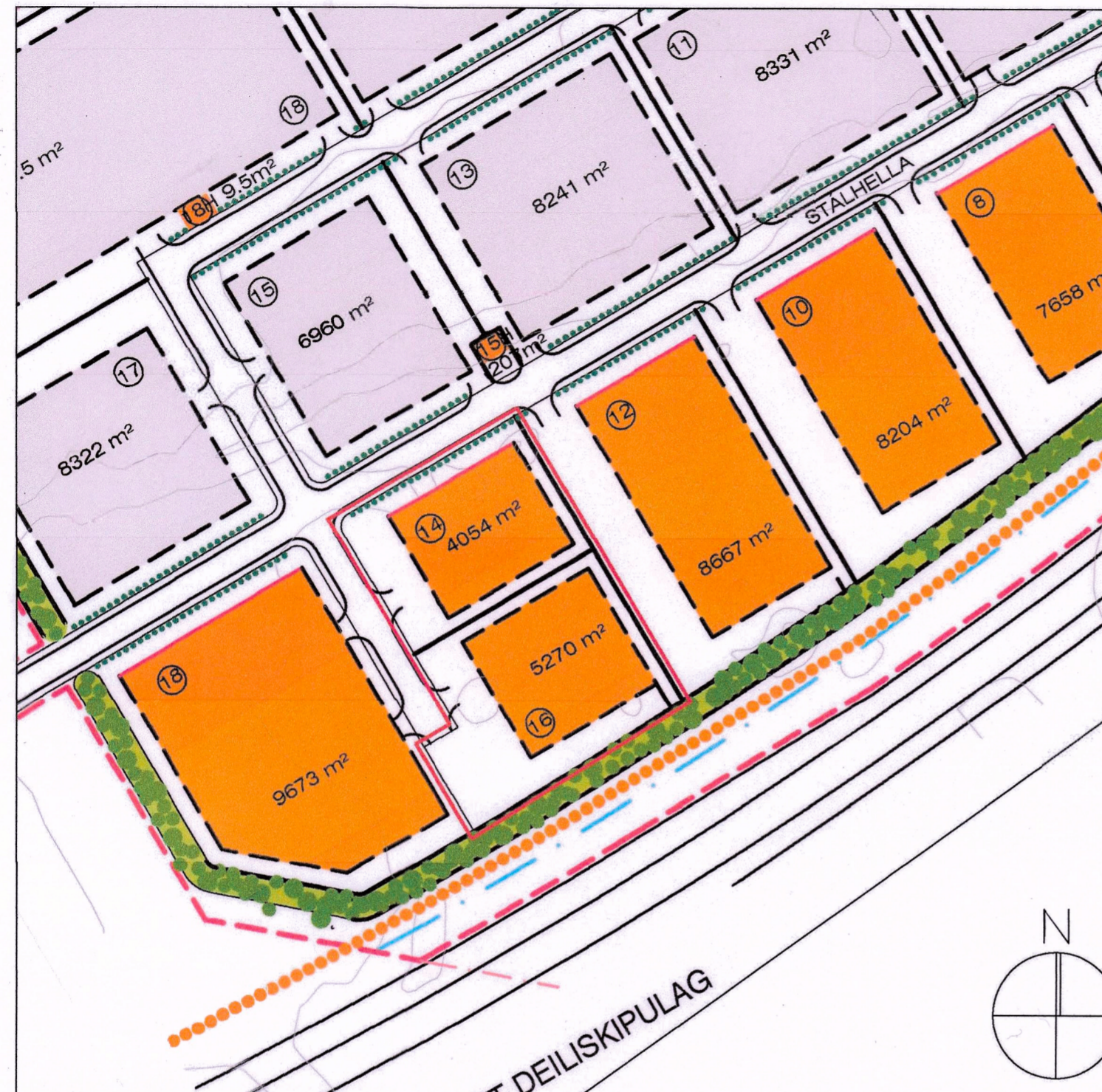
FYRIR BREYTINGU - Í GILDI FRÁ 07.07.2009