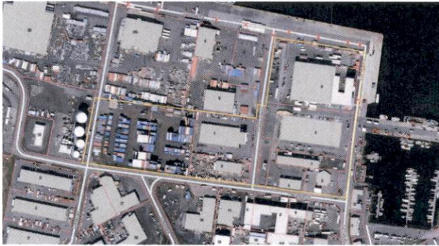
Loftmynd sem sýnir afmörkun miðsvæðis M7 sem tók gildi 12. janúar 2023

Í aðalskipulagsbreytingu sem öðlaðist gildi 12. janúar 2023 afmarkast Miðsvæðið M7 af Óseyrarbraut, Fornubúðum, og lóðarmörkum Óseyrarbrautar 12B og Cuxhavengötu 3, Háabakka og Suðurbakka.