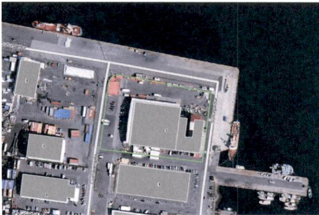
Loftmynd sem sýnir afmörkun miðsvæðis M7 í aðalskipulagsbreytingu sem er í ferli

Þegar breyting sú sem er í vinnslu öðlast gildi afmarkast miðsvæðið M7 af Óseyrarbraut, Cuxhavengötu, Suðurgarði og Fornubúð, sjá mynd hér að framan sem sýnir breytingu á reit M7.