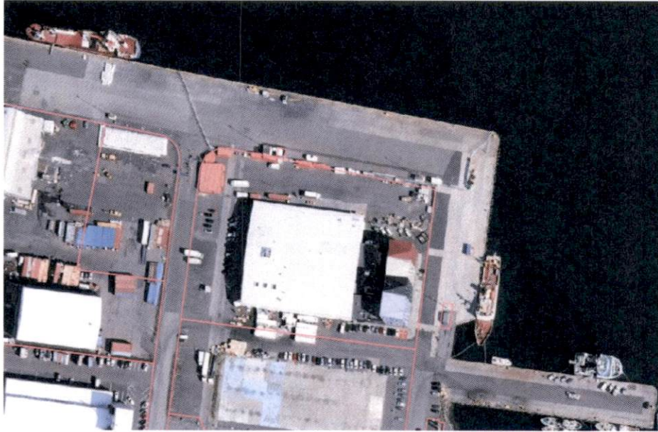
Mynd 2 - Reitur M7, Fornubúðir 5

Á reitnum er í dag skráð 6231m 2 fiskverkunarhús og 4080m 2 skrifstofuhúsnæði, lóðin er 14858m 2 . Stærri húsið á lóðinni, þar sem skráð er fiskverkun, er í dag notað sem iðnaðarhúsnæði, vörugeymsla og skrifstofur. Í minna húsinu eru skrifstofur og rannsóknarstofur. Hugmyndir eru um að byggja meðfram lóðarmörkum til vesturs og norður í framhaldi af nýjstu húsunum á reitnum.