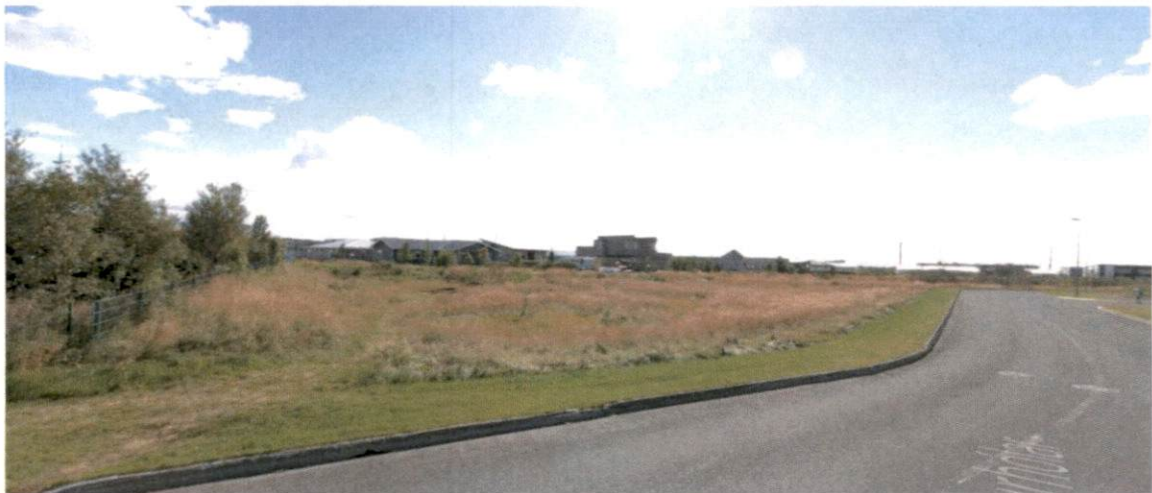
Mynd 2 Horft yfir deiliskipulagssvæðið frá Norðurhólum

Gert er ráð fyrir að lóðirnar stækki inn á grænt svæði milli leikskólalóðar og verslun og þjónustulóðar. Um er að ræða opið svæði sem er að mestu grasi vaxið óræktarsvæði innan bæjarmarka Selfoss. Engar vistgerðir sem njóta verndar eru innan svæðisins og ekkert dýralíf er þekkt á svæðinu.