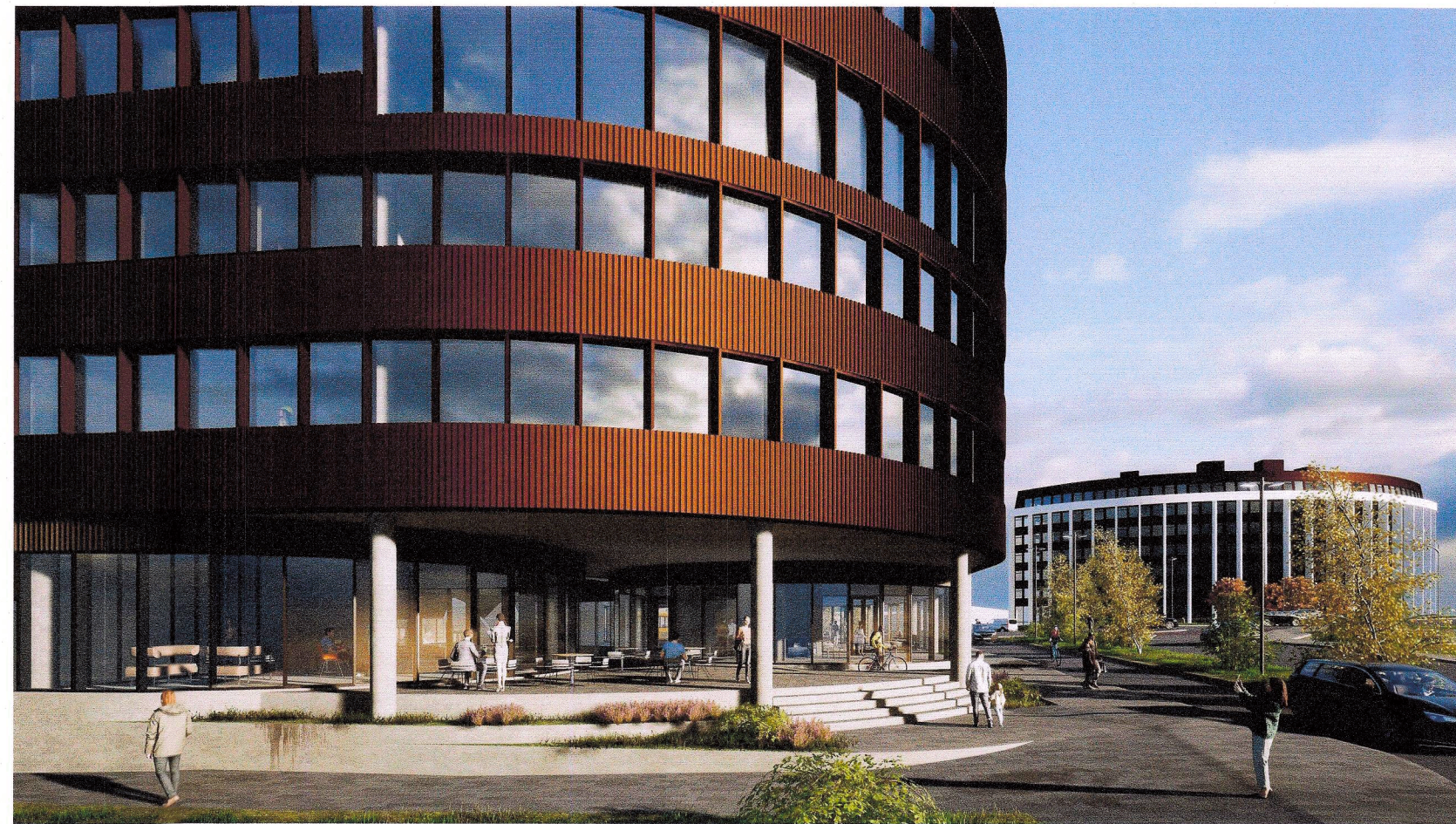
Dvalarsvæði á horni Vagnhöfða og Bildshöfða