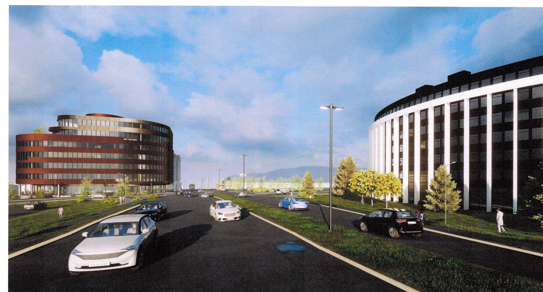
Höfðabakki til norðurs