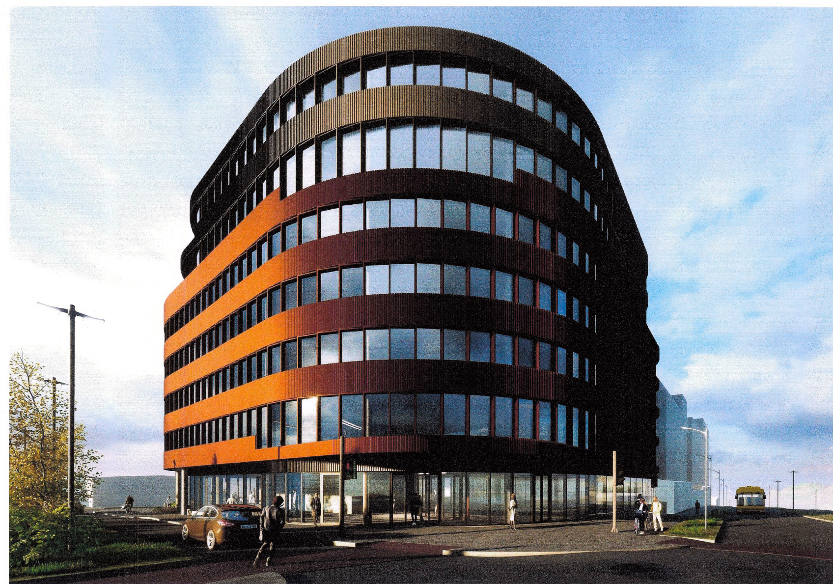
Frá horni Bildshöfða og Höfðabakka