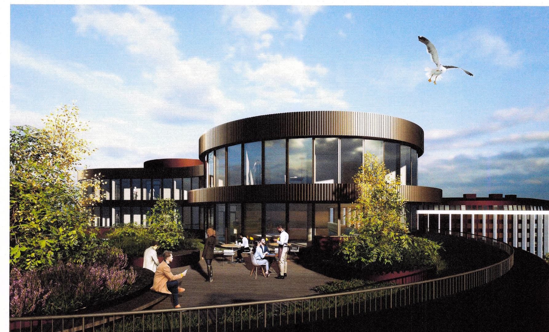
Dvalarsvæði á þakgarði