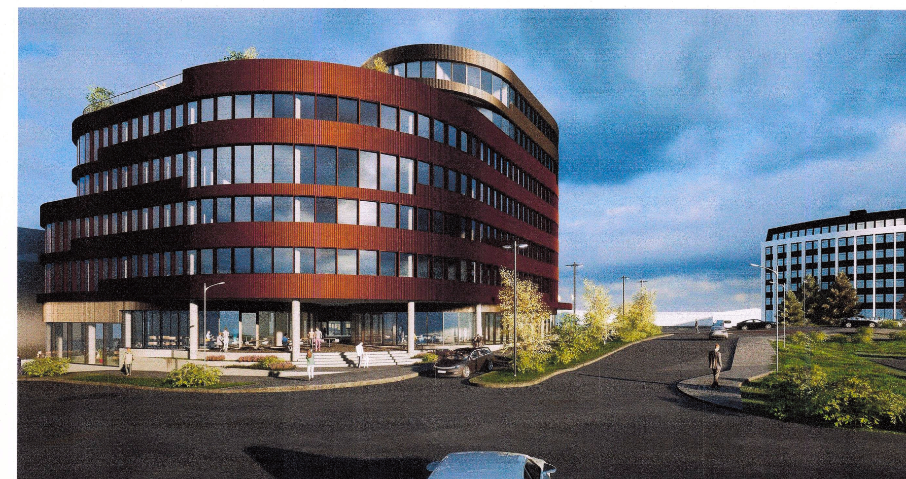
Frá horni Bildshöfða og Vagnhöfða að Höfðabakka