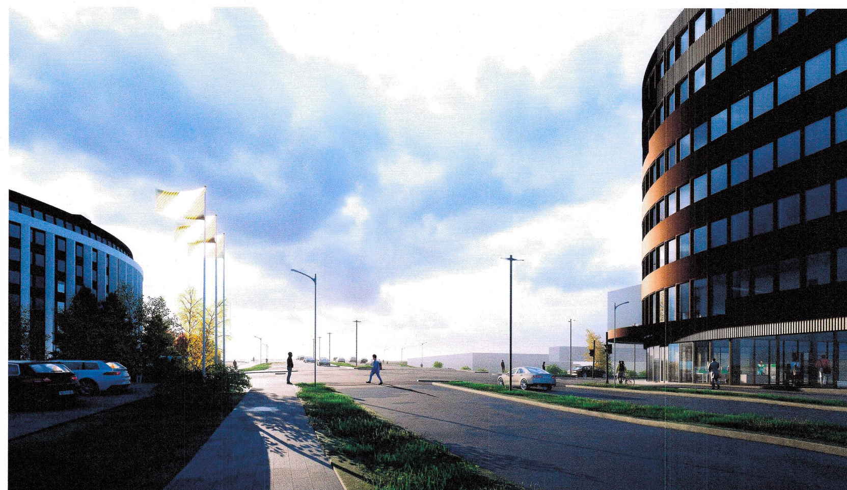
Höfðabakki til suðurs