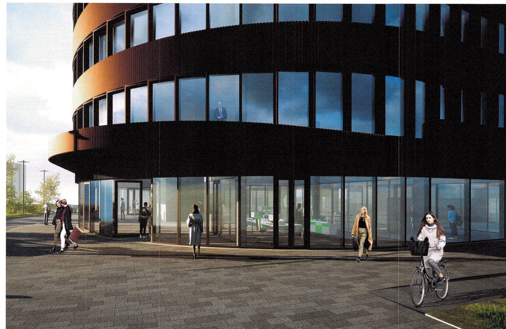
Aðalinngangur á horni Höfðabakka