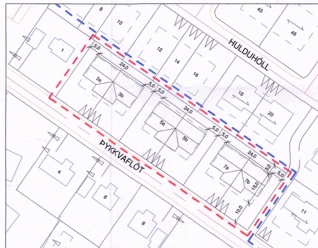
Deiliskipulag eftir breytingu 1 : 1000

- Núgildandi deiliskipulag lóða í Mundakotshverfi, fyrir lóðir Pykkvafliót 3-7, deiliskipulag lóðar samþykkt 19.10.1994 af Skipulagsstjóra ríkisins.