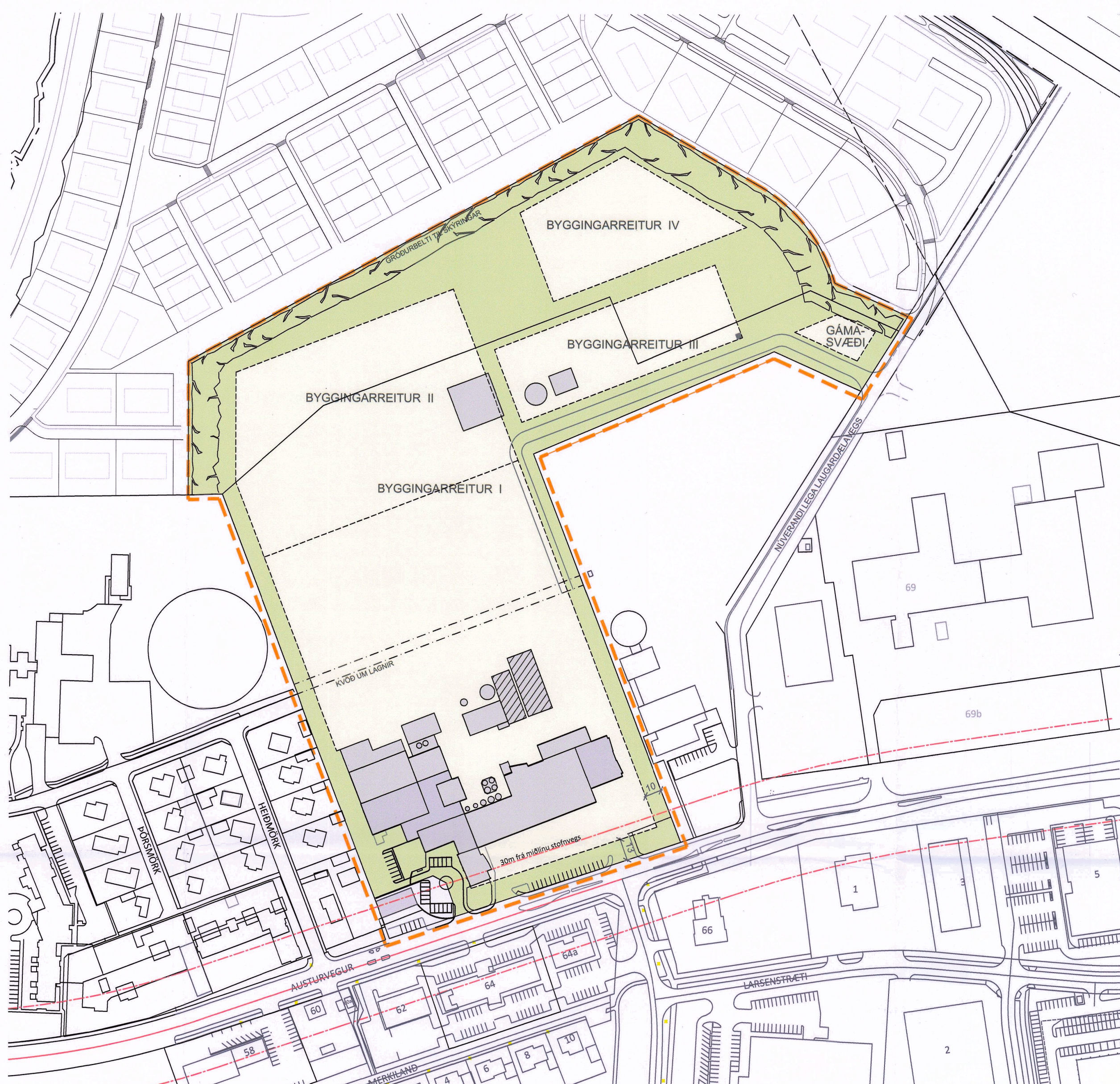
Óveruleg breyting á deiliskipulagi 1:2000