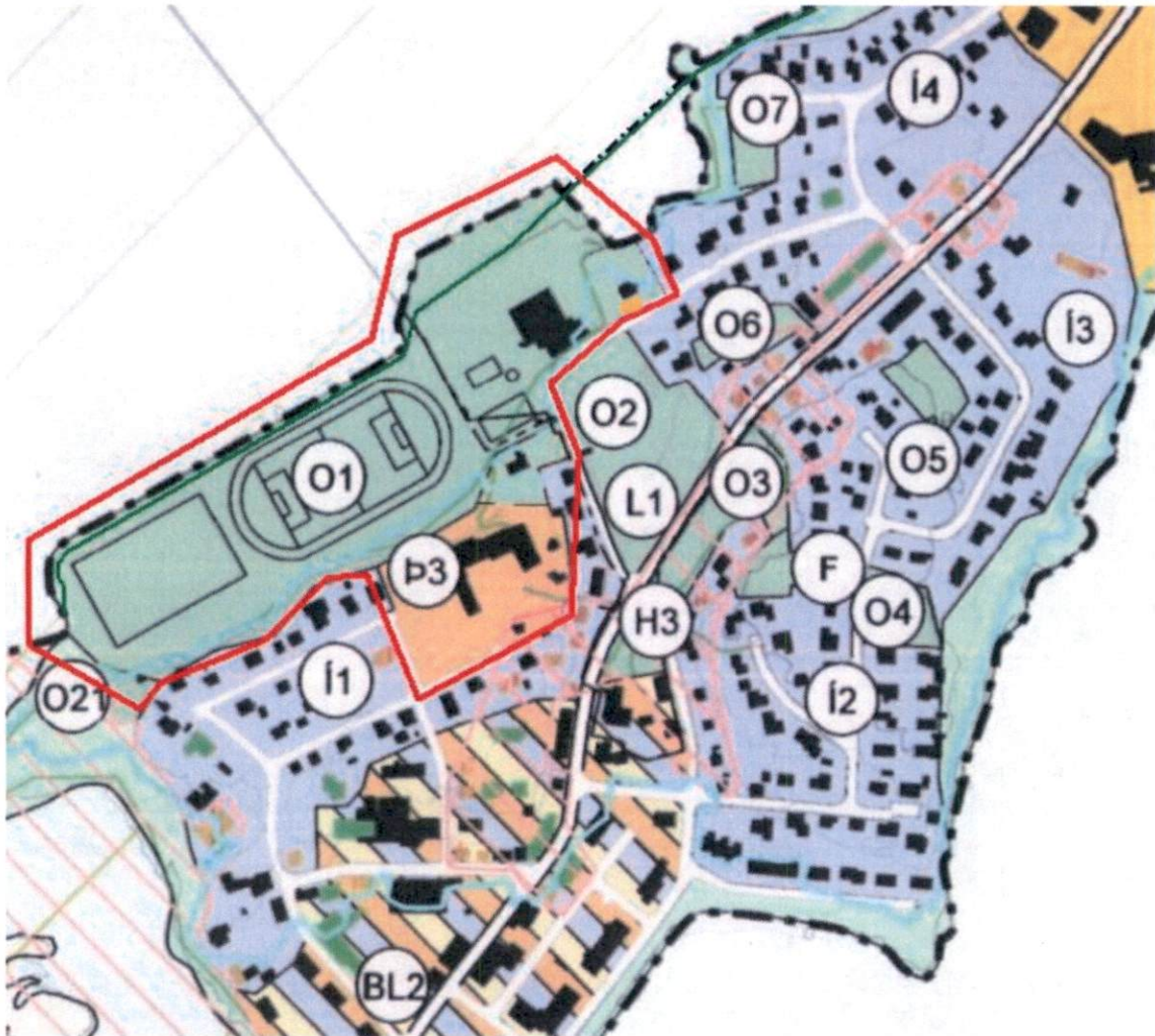
Mynd 1 Hluti af Aðalskipulagi Borgarbyggðar 2010-2022. Svæðið sem breytingum tekur er innan rauða rammans..