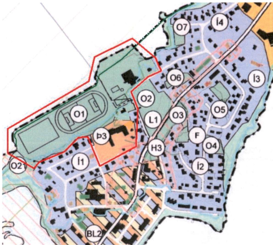
Mynd 3. Uppdráttur eftir breytingu.