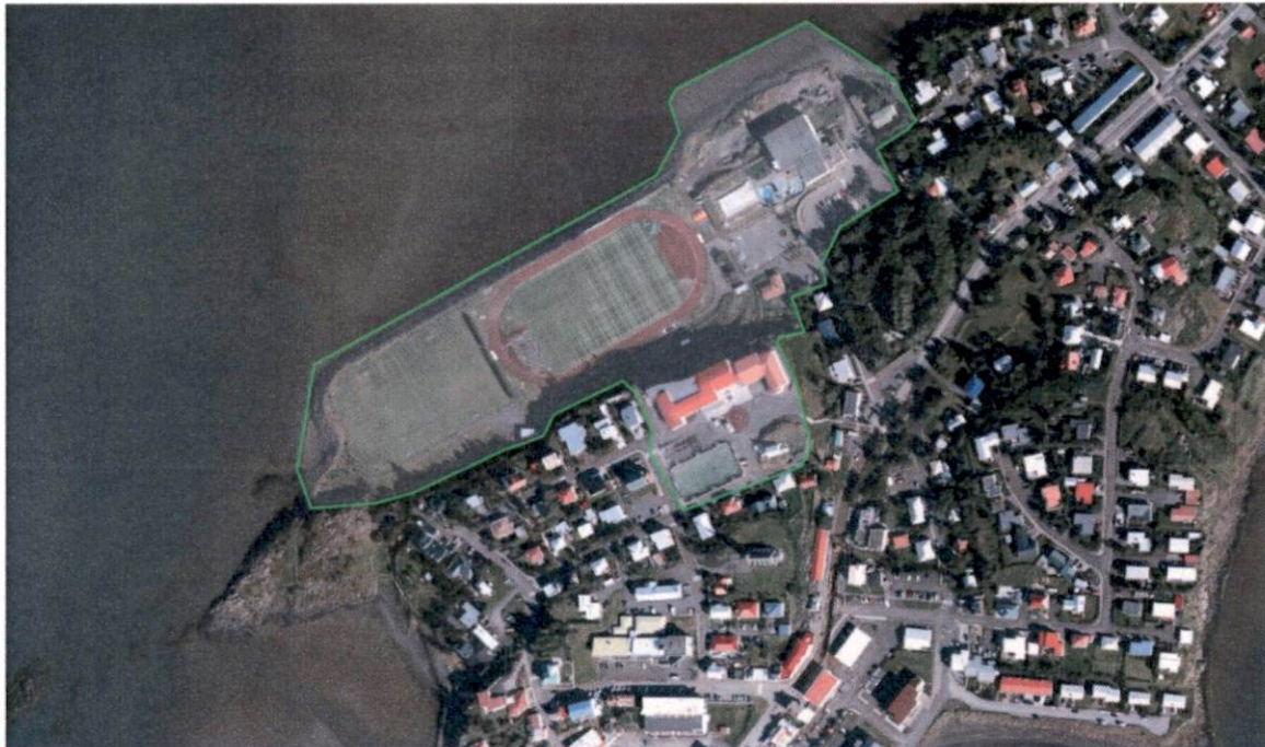
Mynd 2 Loftmynd af breytingarsvæðinu. Svæðið sem breytingum tekur er innan græna rammans.

Aðkoma að svæðinu er um íbúðargöturnar Þorsteinsgötu og Skallagrímögötu. Gönguleið liggur í gegnum svæðið fyrir Vesturnes og áfram meðfram strandlengjunni til suðurs.