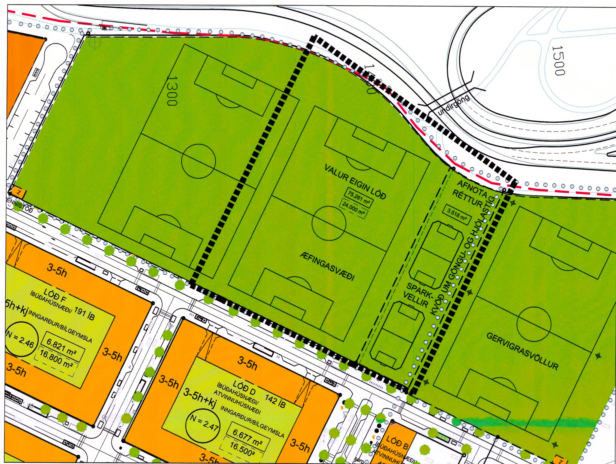
GILDANDI DEILISKIPULAG HLÍÐARENDA DAGS. 2014.04.28 MEÐ SÍÐARI TÍMA Breytingum,