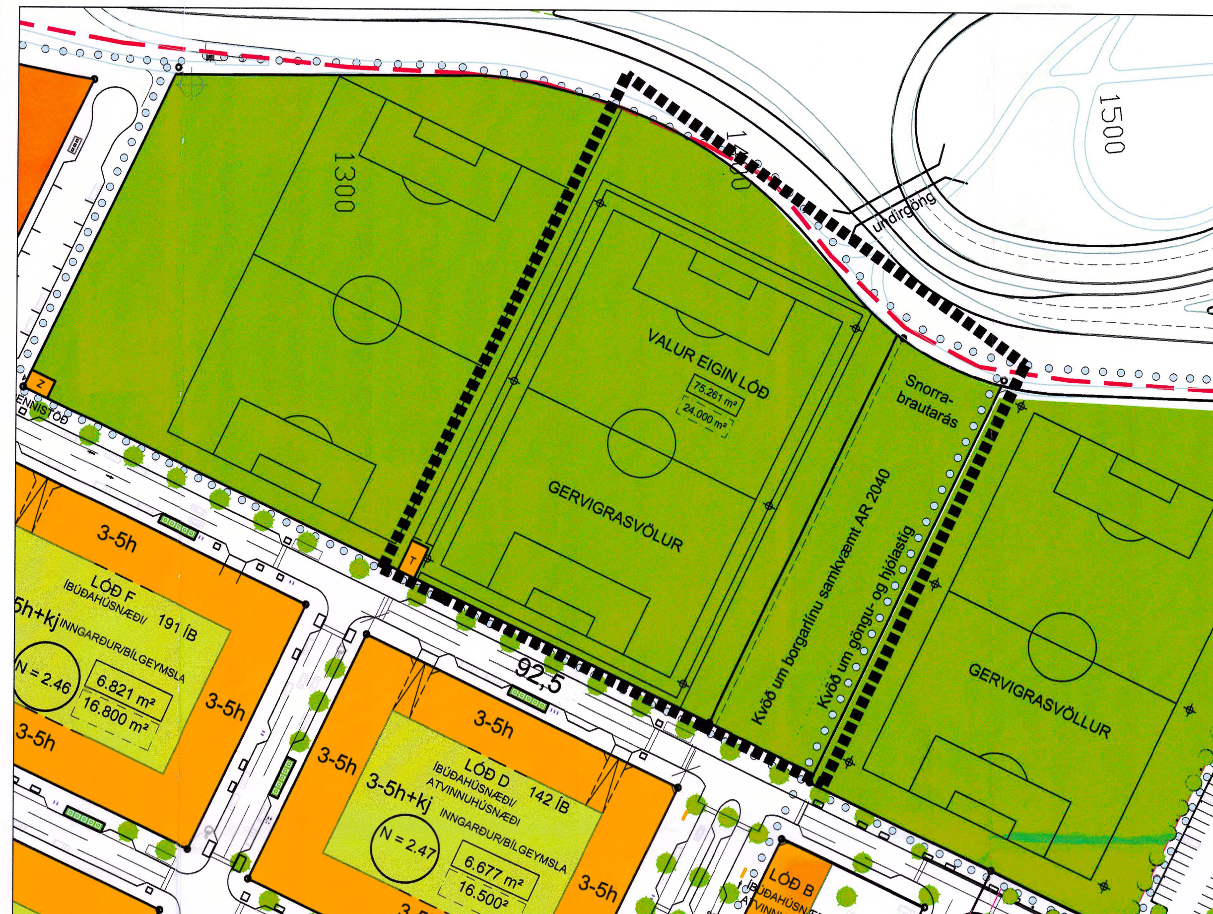
TILLAGA AÐ BREYTTU DEILISKIPULAGI FYRIR HLÍÐARENDA, GERVIGRASVÖLLUR Á SVÆÐI 01c