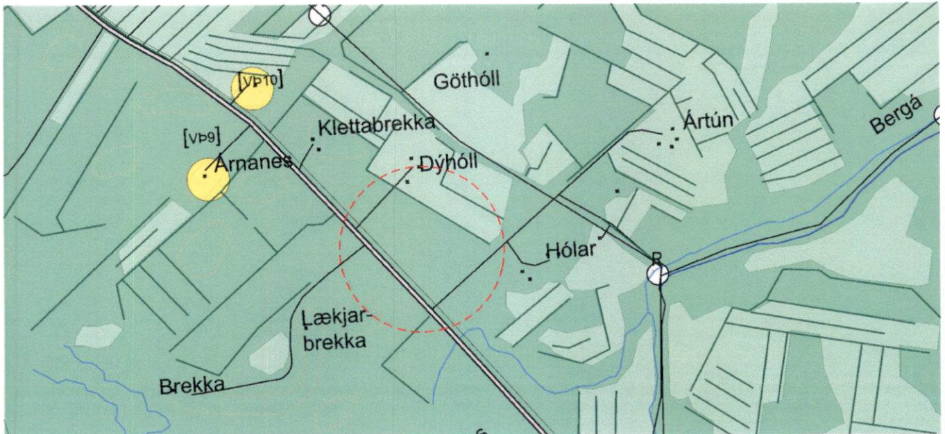
GILDANDI AÐALSKIPULAGSUPPDRAÐTUR 1:15.000

Nýtt verslunar- og þjónustusvæði á Seljavöllum 2