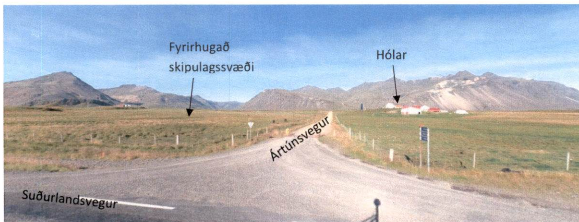
MYND 1 Horft inn á svæðið frá Suðurlandsvegi.

Svæðið fellur ekki í flokk verndarsvæða.