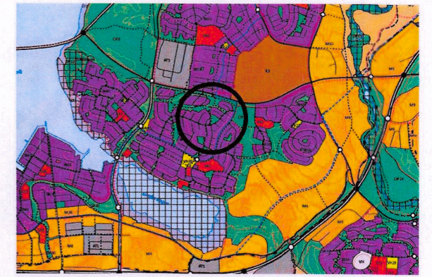
Hluti aðalskipulags Reykjavíkur 2022-2040 Hringur á uppdrætti sýnir staðsetningu.