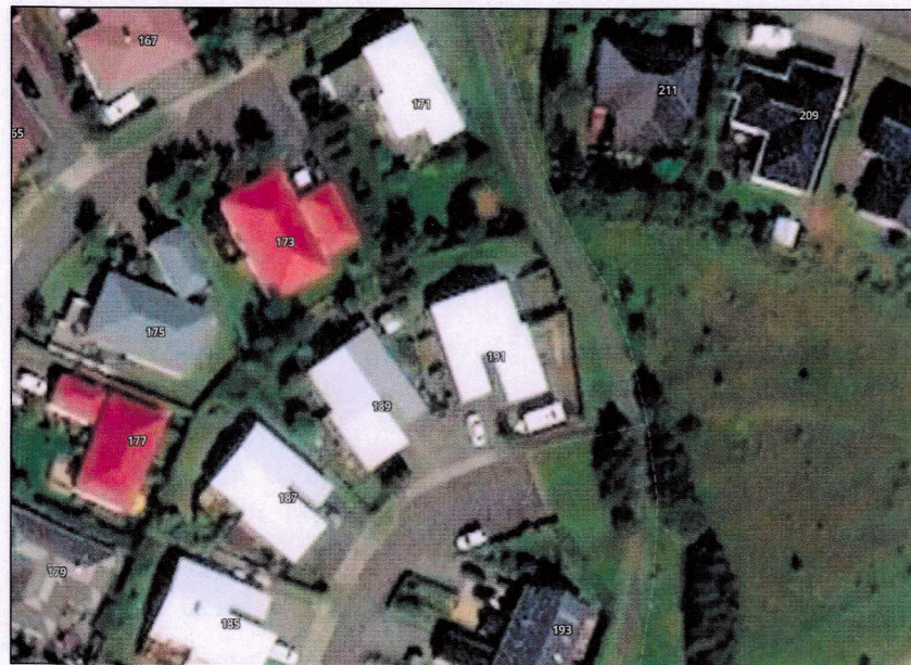
Loftmynd sem sýnir núverandi afstöðu.

Mesta leyfilega stærð aðal hæðar er 200m 2 brúttó. Heimilt er að gera ráð fyrir auka íbúð í húsinu að grunnfleti 70m 2 auk nauðsynlegs geymslurýmis.