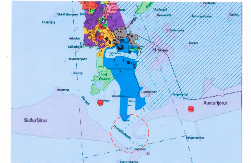
AÐALSKIPULAG Sveitarfélagsins Hornafjarðar 2012-2030