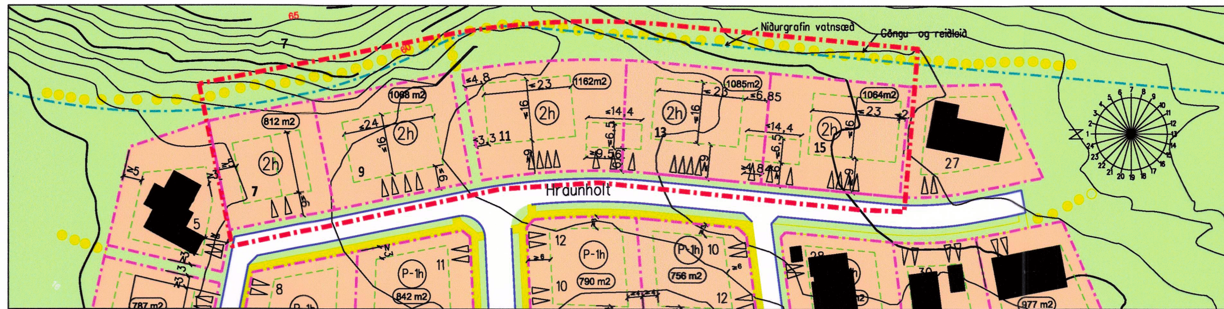
Breytt deiliskipulag Mkv. 1:1000

Úr gildandi deiliskipulagi með síðari tíma breytingum