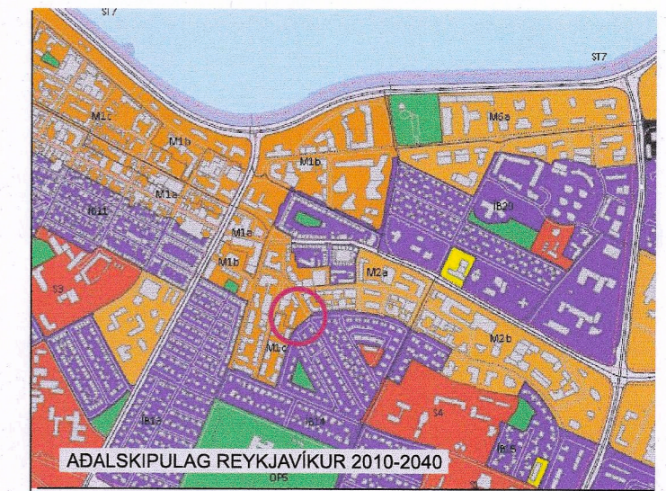
ADALSKIPULAG REYKJAVÍKUR 2010-2040