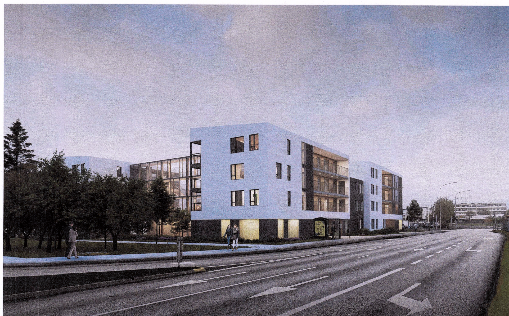
Dæmi um byggingu, séð úr suðaustri Skýringamyndir, byggingar eru dæmi um húsgerð miðað við skilmála deiliskipulags