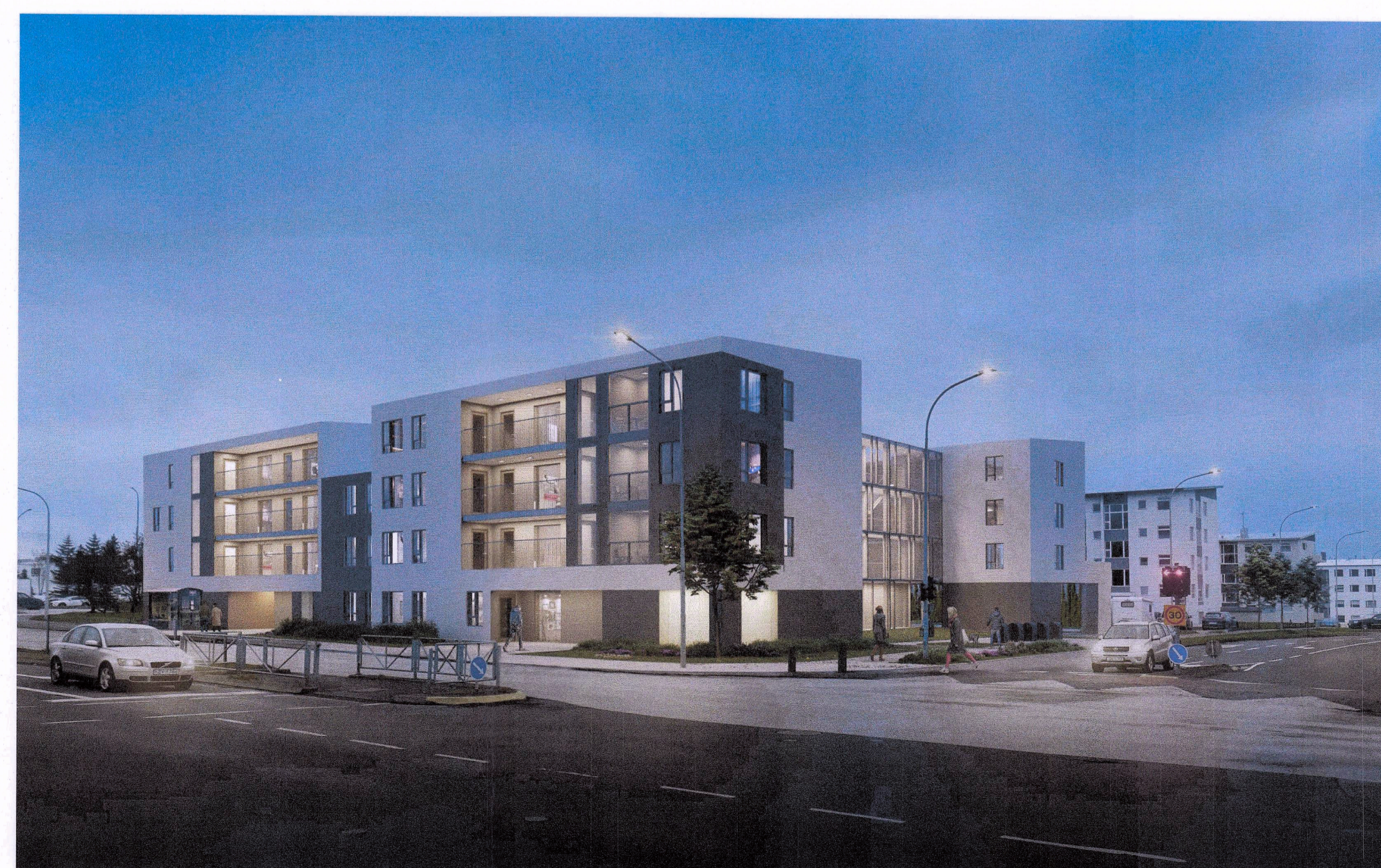
Dæmi um byggingu, séð úr norðaustri

Deiliskipulagsbreyting þessi sem fengið hefur meðferð í samræmi við ákvæði 1.mgr.43 gr. skipulagslaga nr. 123/2010 var samþykkt í umhverfis- og skipulagsráði þann 13.mars 2024 og í borgarráði þann 14.mars 2024 . Tillagan var auglýst frá 14. desember 2023 með athugasemdafresti til 21. janúar 2024 . Auglýsing um glíðisöku breytingarinnar var birt í B-deild Stjórnartíðna þann 21. júní 2023 . Þórunn Ástheim Gríma arkitektar Gríma arkitektar ehf., Laugavegi 178, 105 Rvk. sími: 897 3760 sigga@grimark.is www.grimark.is Sigríður Ólafsdóttir, arkitekt FAl kt. 071070-5069 A2F A2F arkitektar ehf., Laugavegi 178, 105 Rvk. sími: 571 5500 a2f@a2f.is www.a2f.is Aðalheiður Alladóttir, arkitekt FAl kt. 120975-6879 Falk Kröger, arkitekt FAl kt. 061175-2539