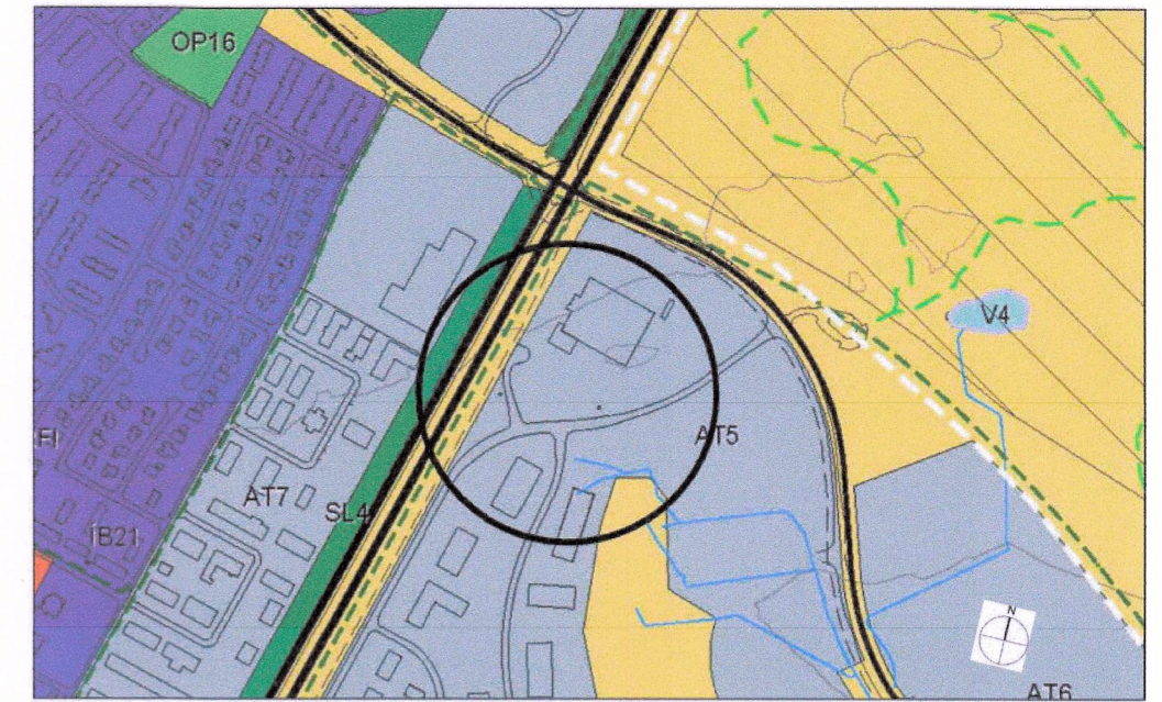
Aðalskipulag Akureyrar 2018-2030. Kvarði, 1:20000