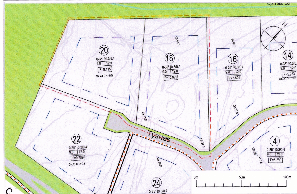
Tillaga að breytingu á deiliskipulagi Mkv. 1:2000