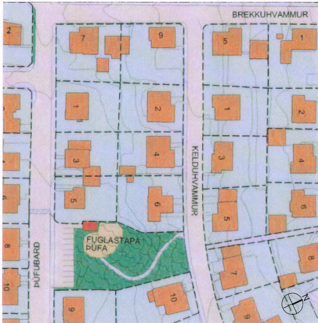
FYRIR BREYTINGU - Í GILDI FRÁ 03.07.2003