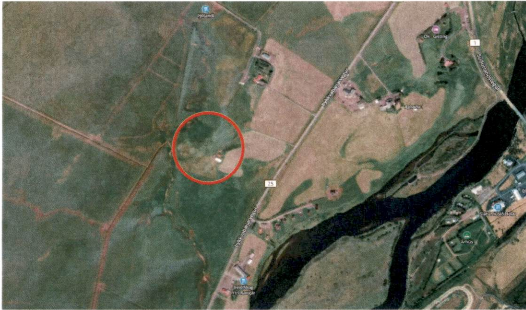
MYND 1. Skipulagssvæðið er innan rauða hringsins.