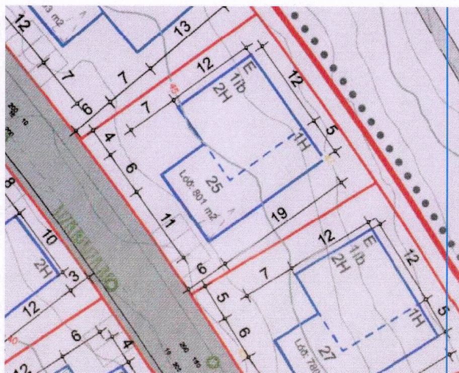
FYRIR BREYTINGU - Í GILDI FRÁ 12.08.2019 MKV 1:500