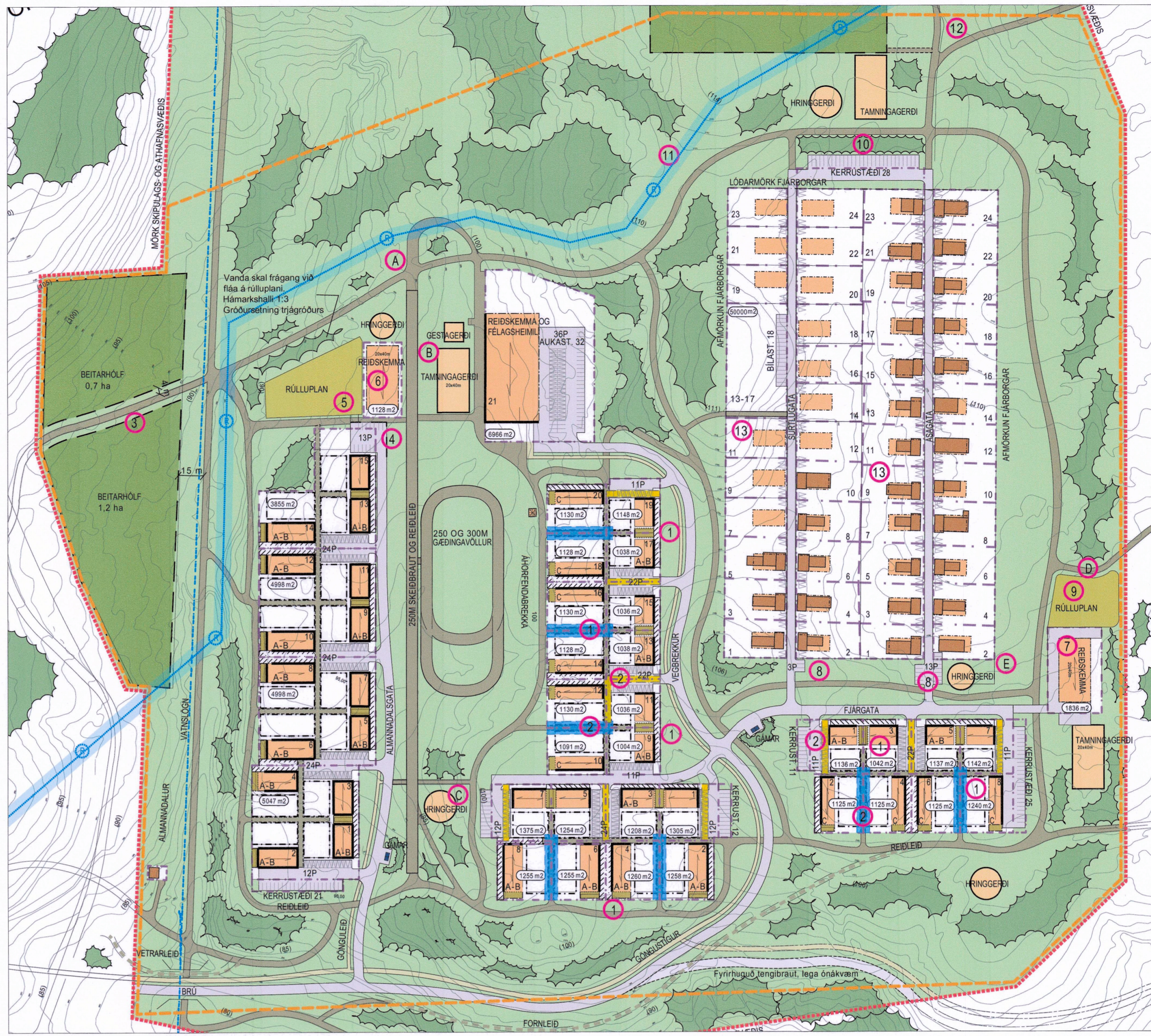
Tillaga að breytingu deiliskipulags, sjá nánar í greinargerð mkv. 1:2000