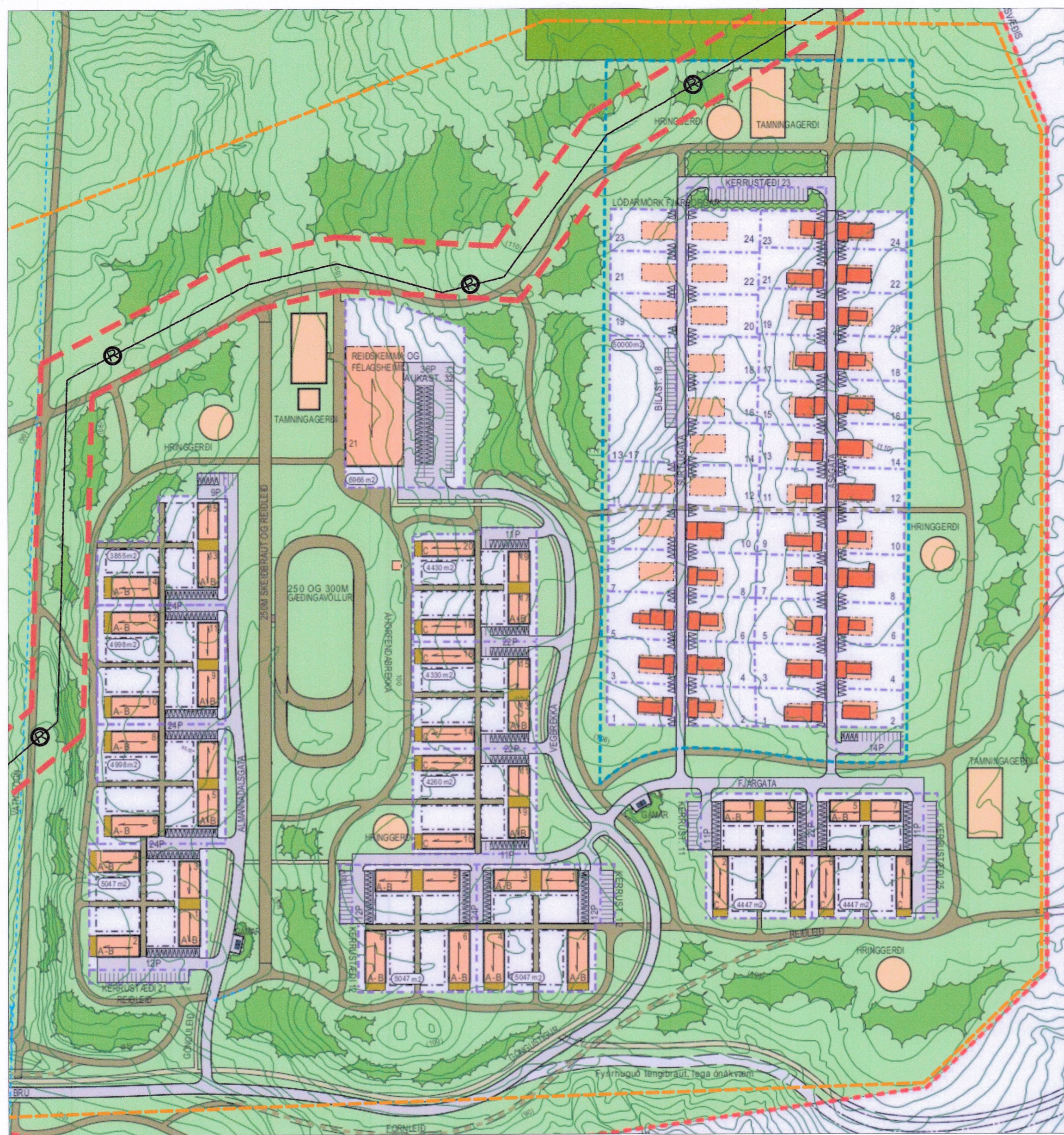
Gildandi deiliskipulag Hesthúsabýggðá Hölmshéið, Almannaðalur dags B. deildar augl 12.11.2003, síðast breytt 20.05.2020. mkv 1:2000