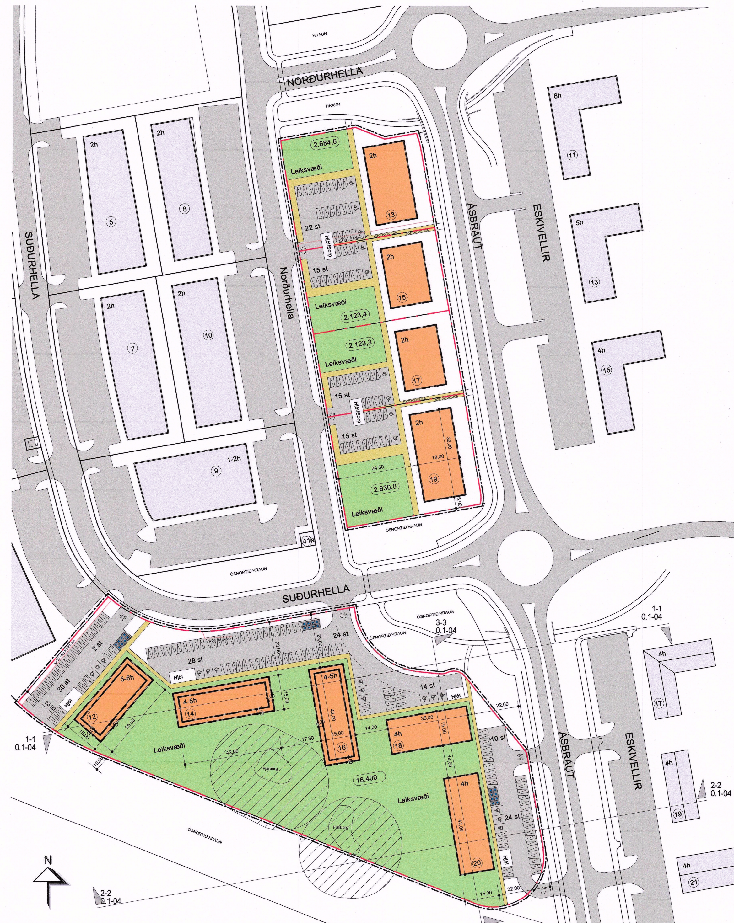
BREYTING Á HLUTA GILDANDI DEILISKIPULAGSÁÆTLUNAR, SELHRAUN SUÐUR, FYRIR LÓÐIRNAR NORÐURHELLU 13-19 OG SUÐURHELLU 12-20, 1:1000