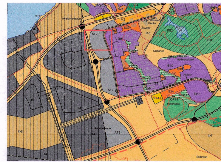
HLUTI AF AÐALSKIPULAGI HAFNARFJARÐAR 2013-2025.