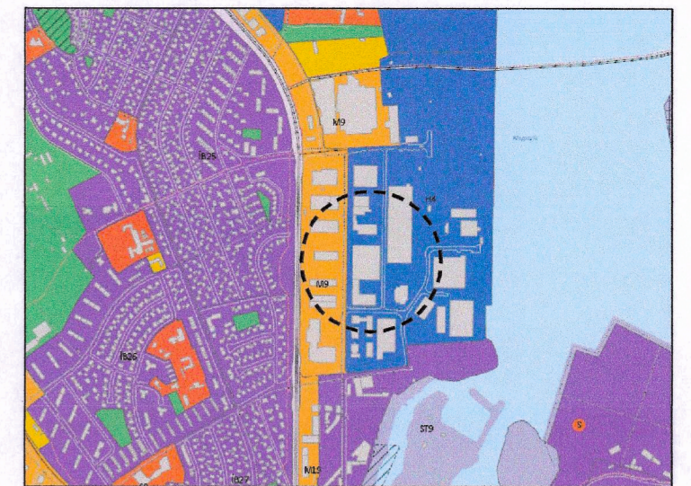
Gildandi aðalskipulag Reykjavíkur 2010 - 2030 - Hlutamynd