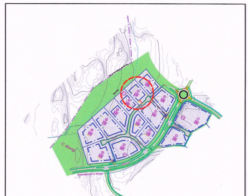
Heildarskipulag Krossaneshaga, C áfanga. kvarði 1:10000