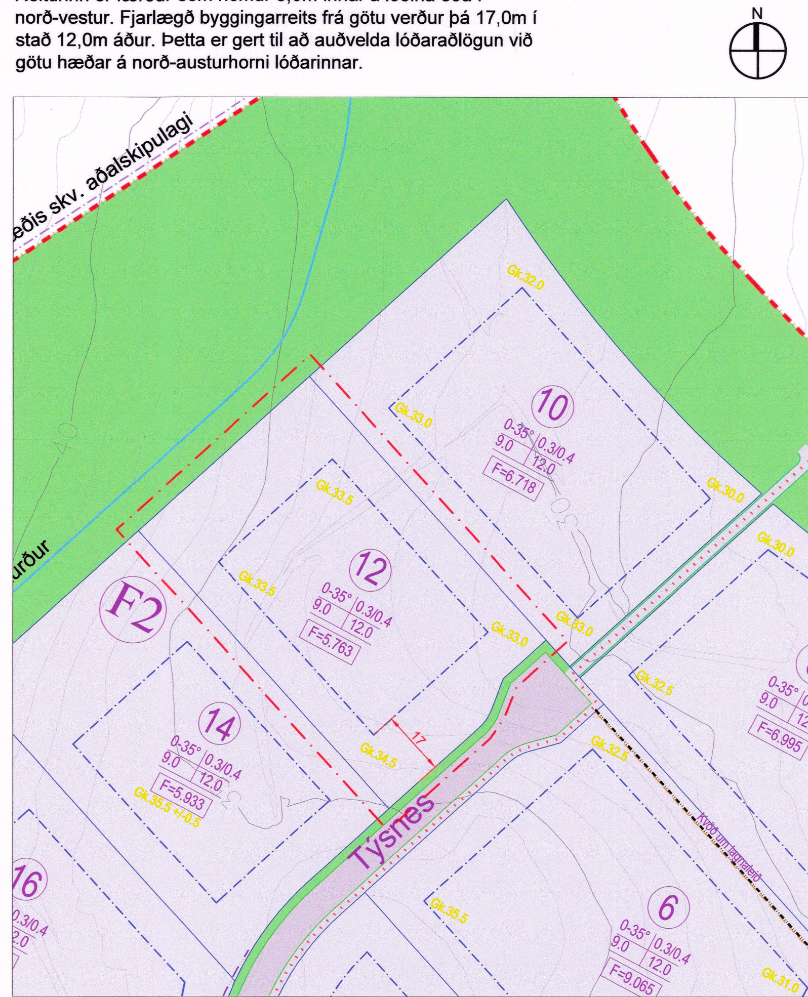
Breyttur byggingarreitur lóðar nr. 12