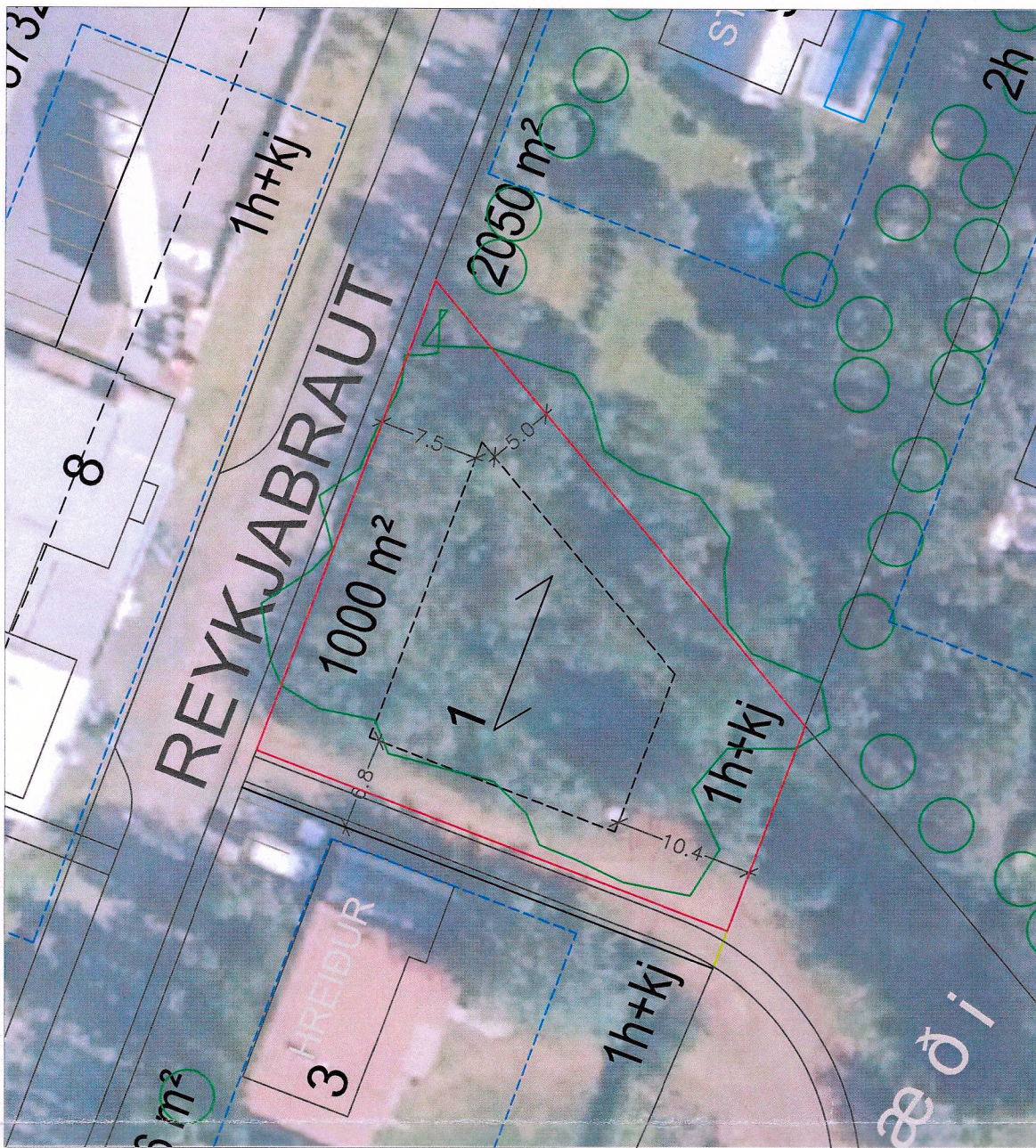
Deiliskipulag fyrir breytingu