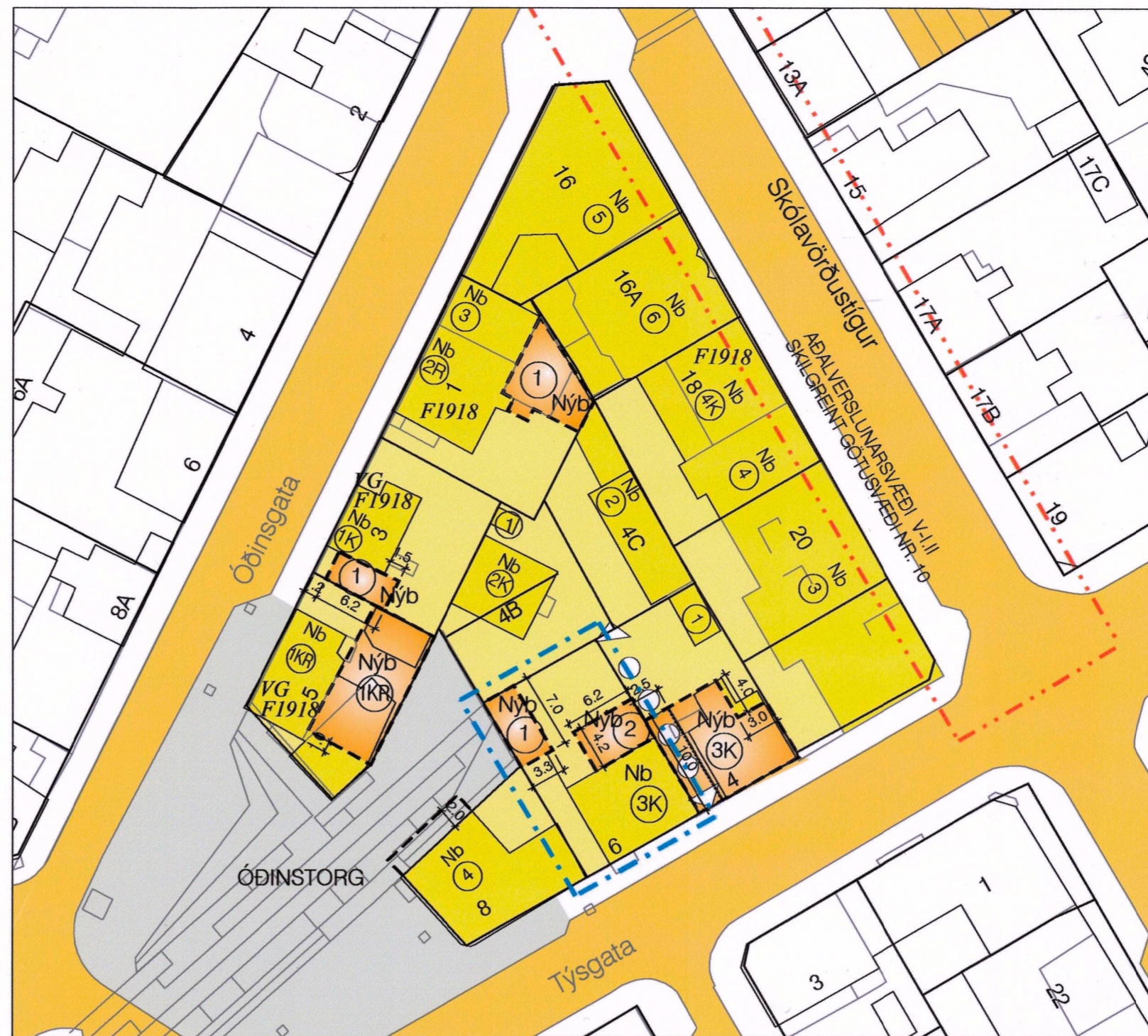
GILDANDI DEILISKIPULAG Á REIT 1.181.0, SAMÞYKKT Í BORGARRÁÐI 04.02.2003 M.S.BR. MKV. 1:500