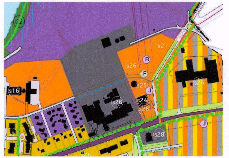
HLUTI AÐALSKIPULAGS ÁRBORGAR 2010-2030