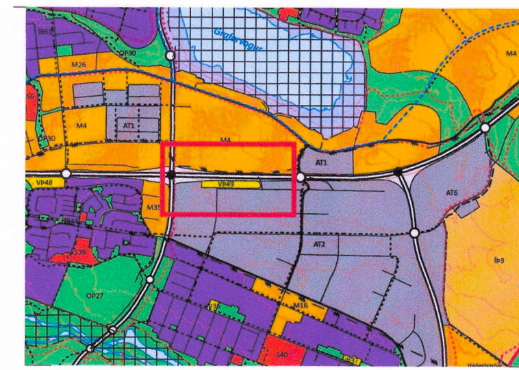
HLUTI AF AÐALSKIPULAGI REYKJAVÍKUR 2040.

Kvöð um jarðsímastreng og gróft eða færslu skv. reglum símsstöðvar er yfir vestanverða lóðina. Vegtenging er leyfileg frá tengibrautum og Grjóthálsi að uppfylltum nánari skilyrðum Vegargerðar ríkisins og gatnamálastjóra.