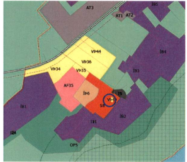
Aðalskipulag Bláskógabyggðar 2015-2027