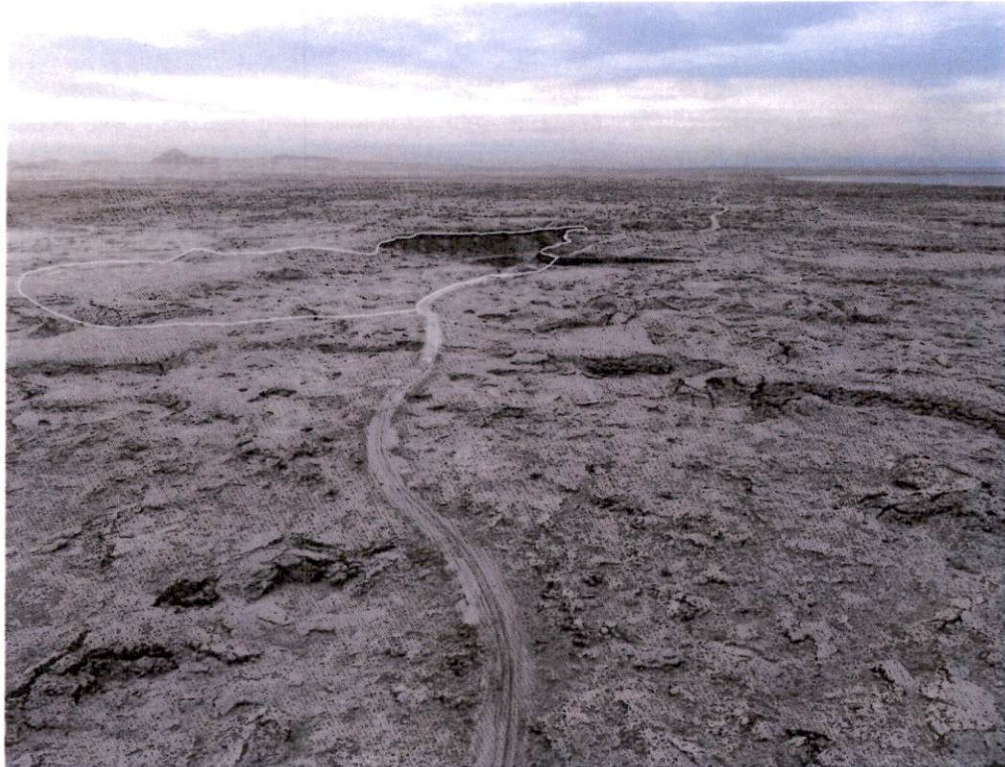
Mynd 7.2 Fyrirhugað vinnslusvæði við Rauðamelsnámu

Stefnt er að því að flytja 180.000 m 3 14 af stórgrýti og mulningi úr Rauðamelsnámu. Mynd 7.2 sýnir fyrirhugað vinnslusvæði við námuna. Efnistakan mun breyta ásýnd og landslagi við námuna. Náman er lítið sýnileg frá Reykjanesbraut. Hins vegar er göngu- og hjólastígur skilgreindur í gegnum svæðið og mun náman hafa neikvæð áhrif á ásýnd frá göngu- og hjólastíg.