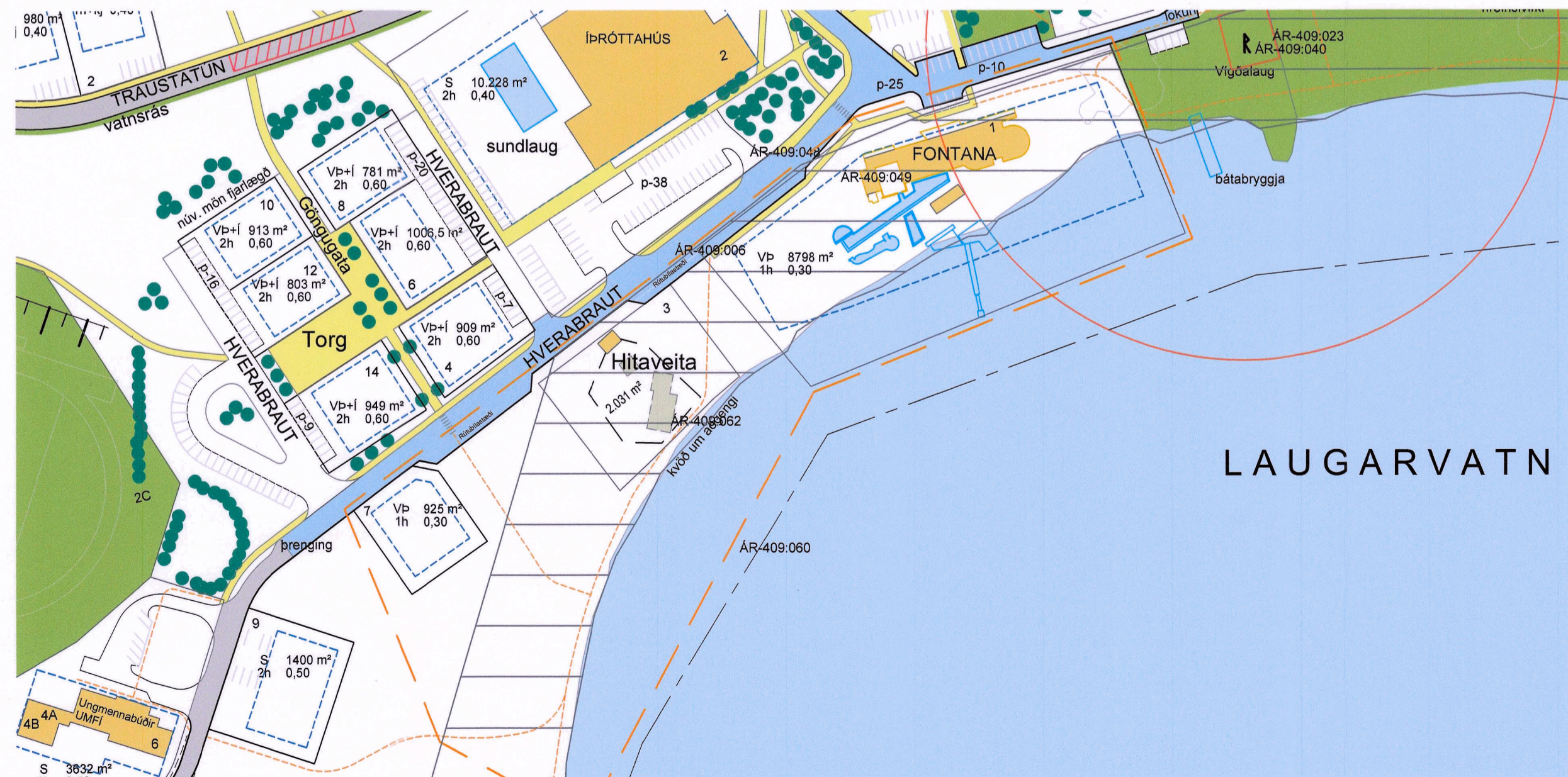
DEILISKIPULAG EFTIR BREYTINGU 1:1500