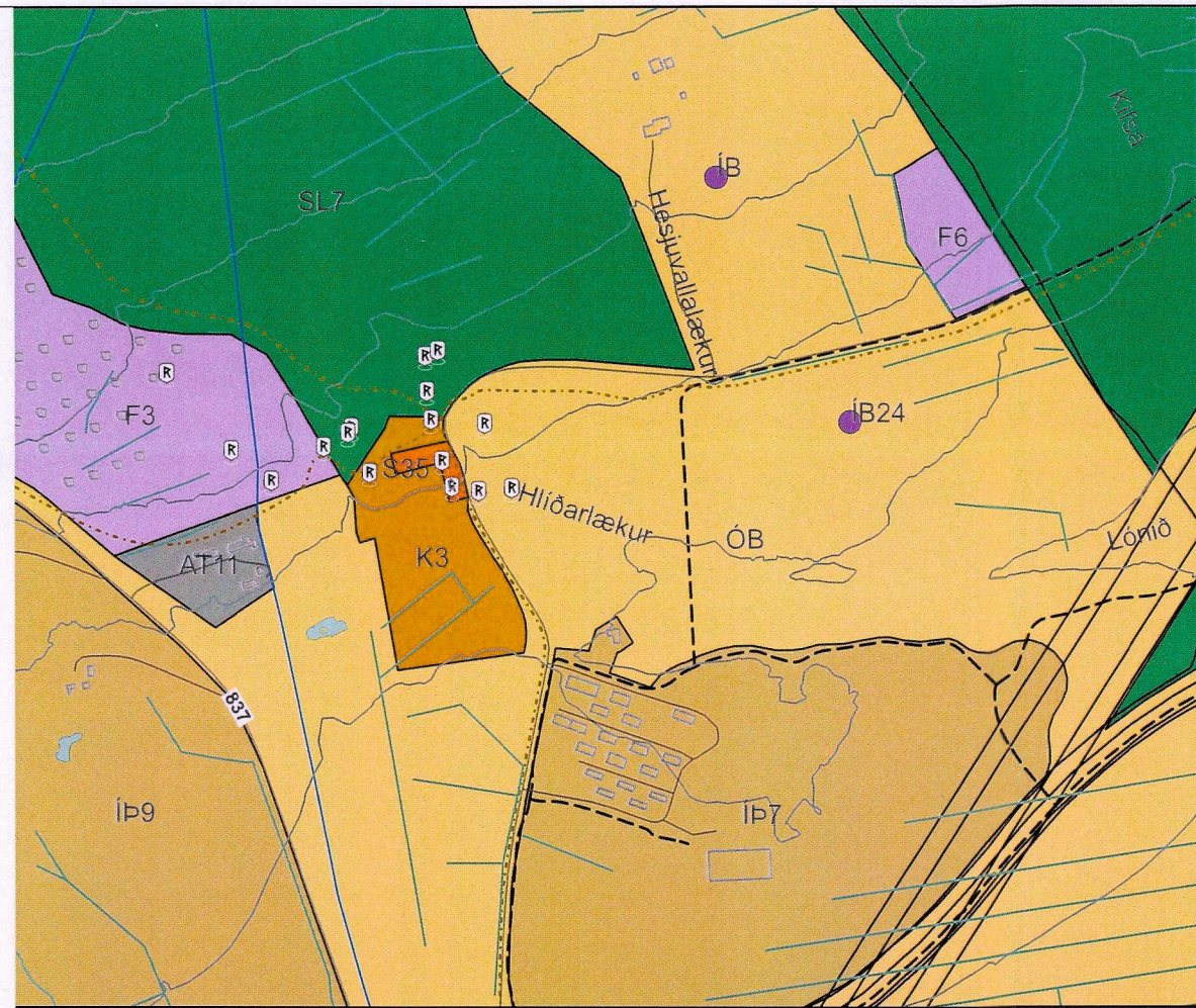
SKILDANDI AÐALSKIPULAG M.S.BR. ÖÐLAÐIST GILDI 14.05.2018