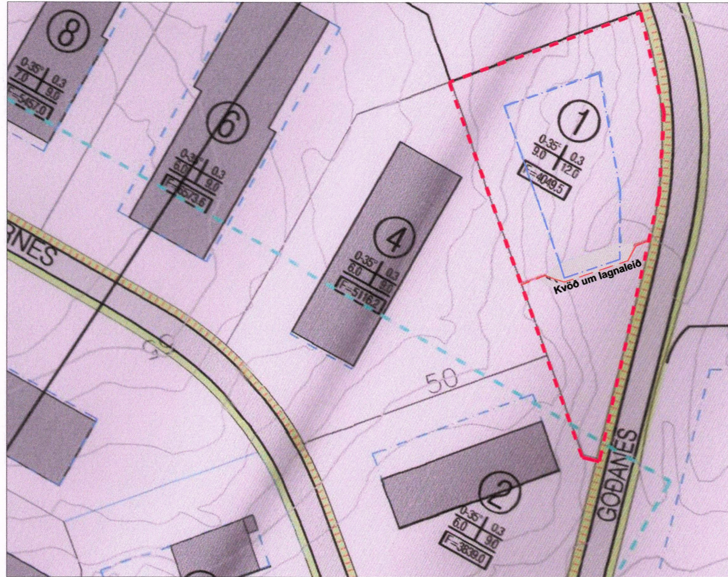
Gildandi deiliskipulag. Tók gildi 06.07.2022