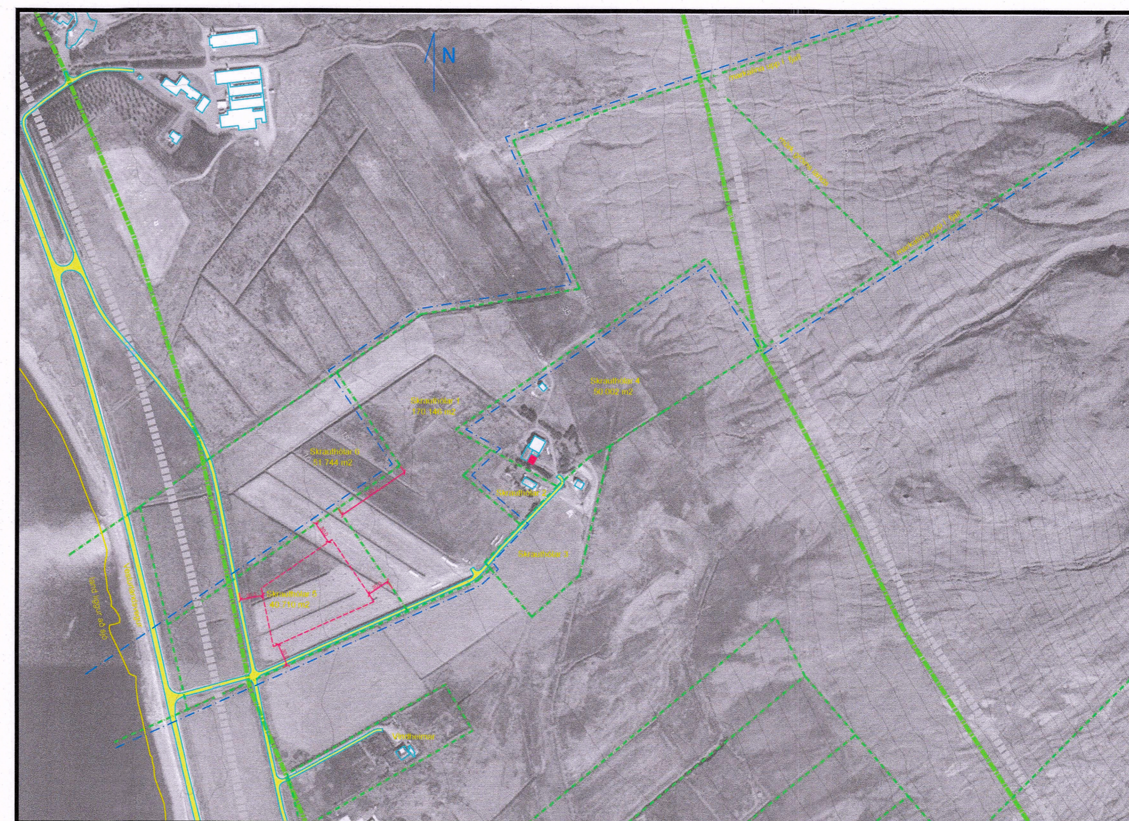
Tillaga að deiliskipulagi jarðarinnar Skrauthóla á Kjalarnesi