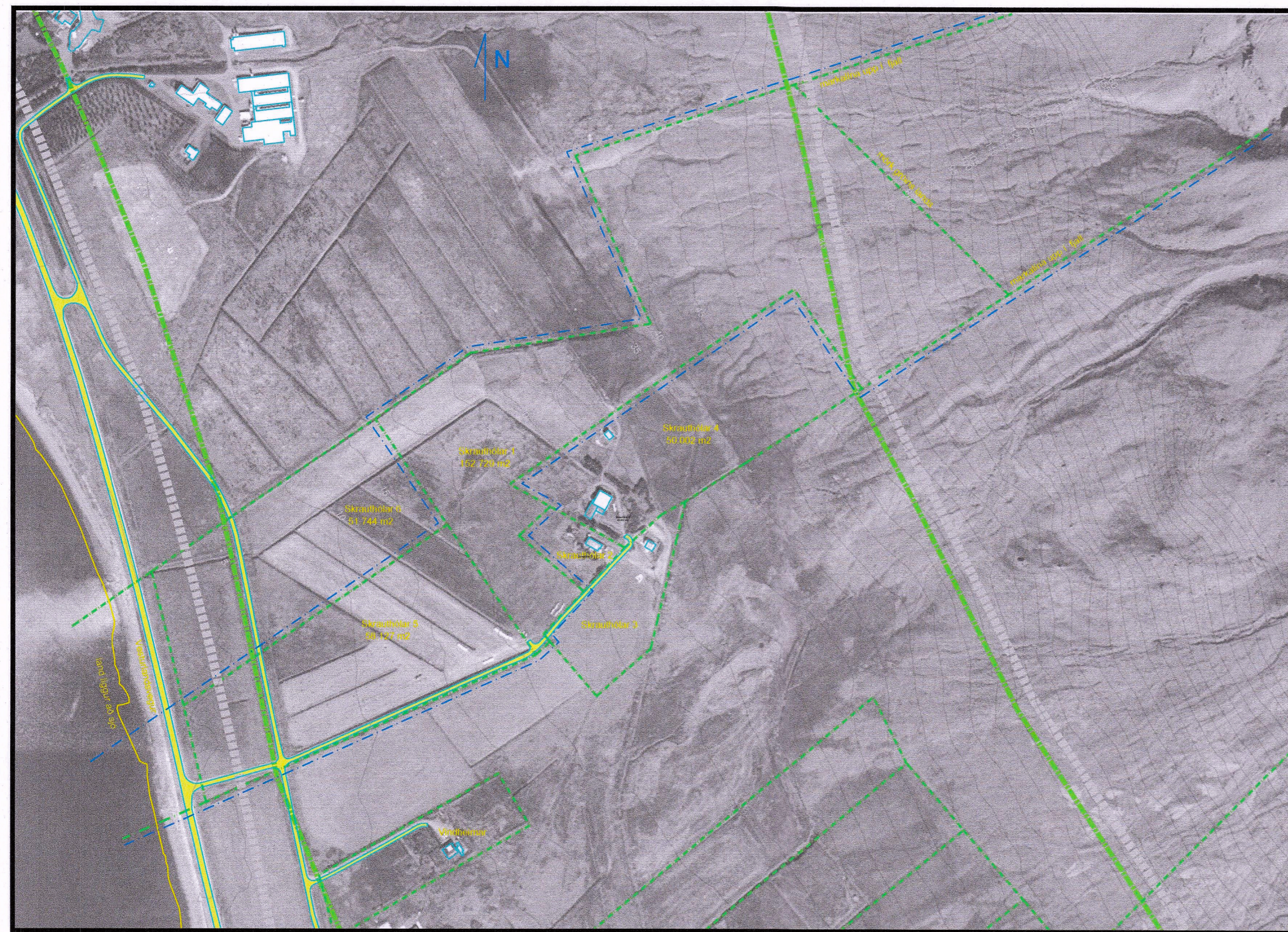
Núverandi ástand jarðarinnar Skrauthóla á Kjalarnesi