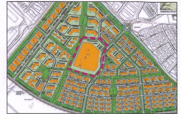
Staðsetning breytingar sýnd í samhengi við hverfið