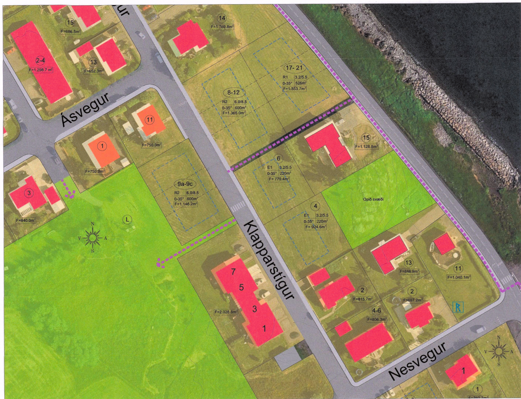
Gildandi deiliskipulag tók gildi 28. nóvember 2022 með síðari breytingum - mkv. 1:1000