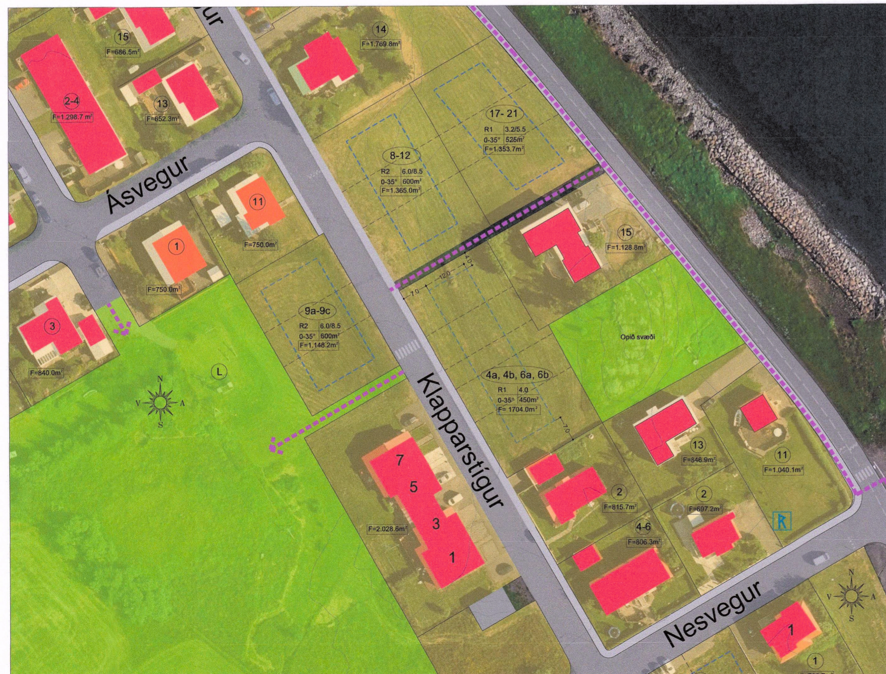
Breyting á deiliskipulagi Klapparstígs 4 - 6 - mkv. 1:1000