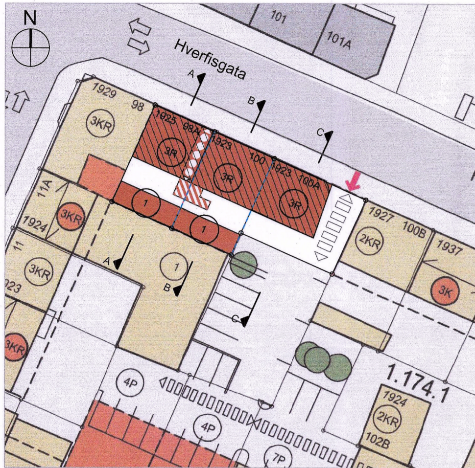
GILDANDI DEILISKIPULAG HVERFISGATA 100 (98A, 100, 100A) og bílastædalóð 100C Staðfest 19. október 2022 M 1 : 500