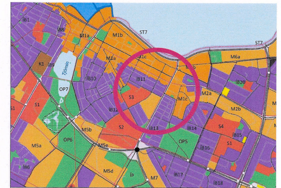
HLUTI AF AÐALSKIPULAGI REYKJAVÍKUR 2040

Að öðru leyti gilda fyrri skilmálar reits 1.174.1 sem samþykktir voru í borgarráði 9. júní 2005, breyting á deiliskipulagi reits 1.174.1 sem samþykkt var í borgarráði 16. ágúst 2019, 20. janúar 2022 og 19 október 2022.