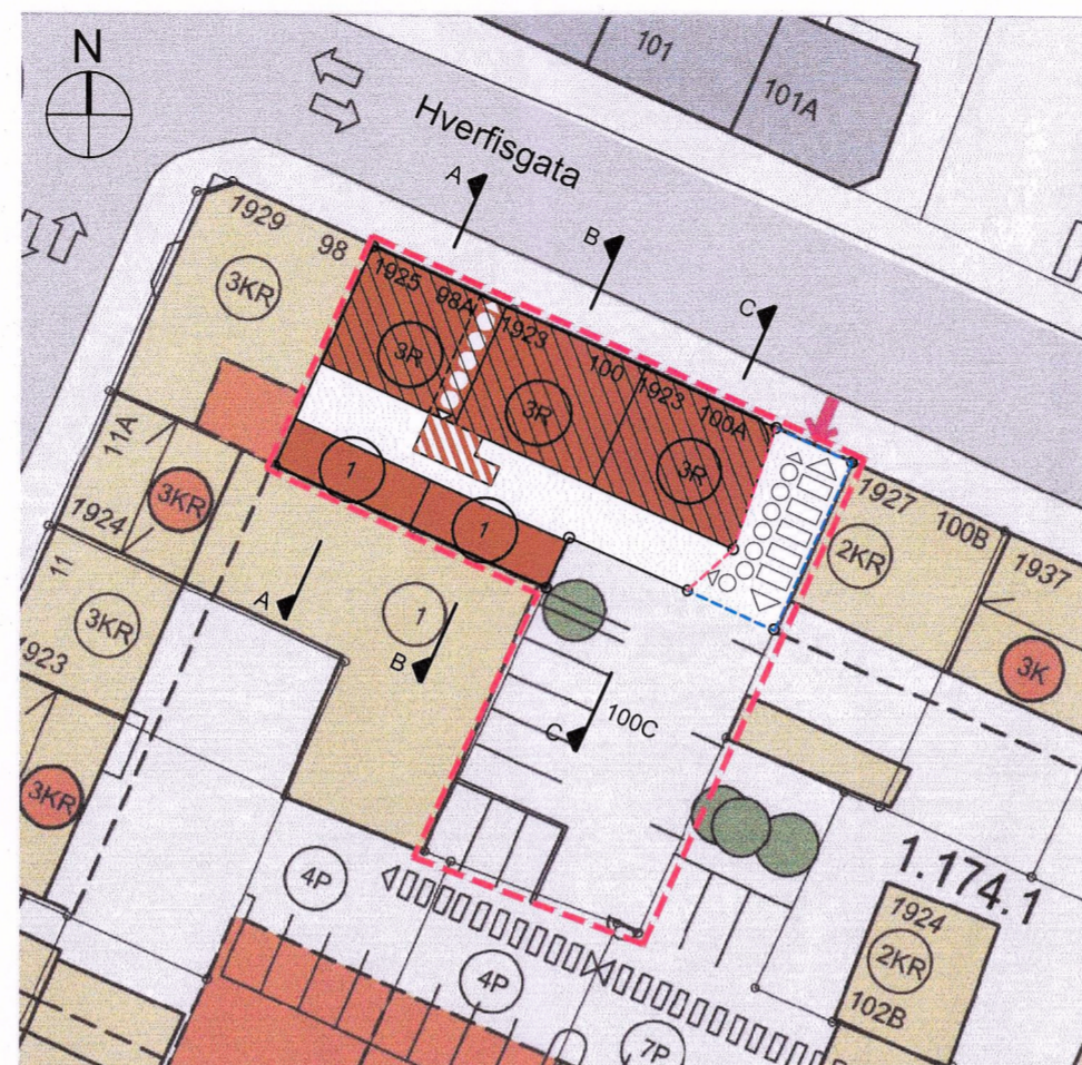
TILLAGA AÐ BREYTTU DEILISKIPULAGI SAMEINUÐ LÓÐ HVERFISGÖTU 100 ÁSAMT BÍLASTÆDALÓÐ 100C M 1 : 500

Helstu breytingar: Breyting á lóðarmörkum. Lóð Hverfisgötu 100 (fyrir sameiningu 98A,100,100A) minnkar úr 401m 2 í 348m 2 , byggingarmagn hennar er óbreytt en nýtingarlutfall breytist í samræmi við minnkun lóðarinnar. Lóð Hverfisgötu 100C stækkar úr 272m 2 í 325m 2 .