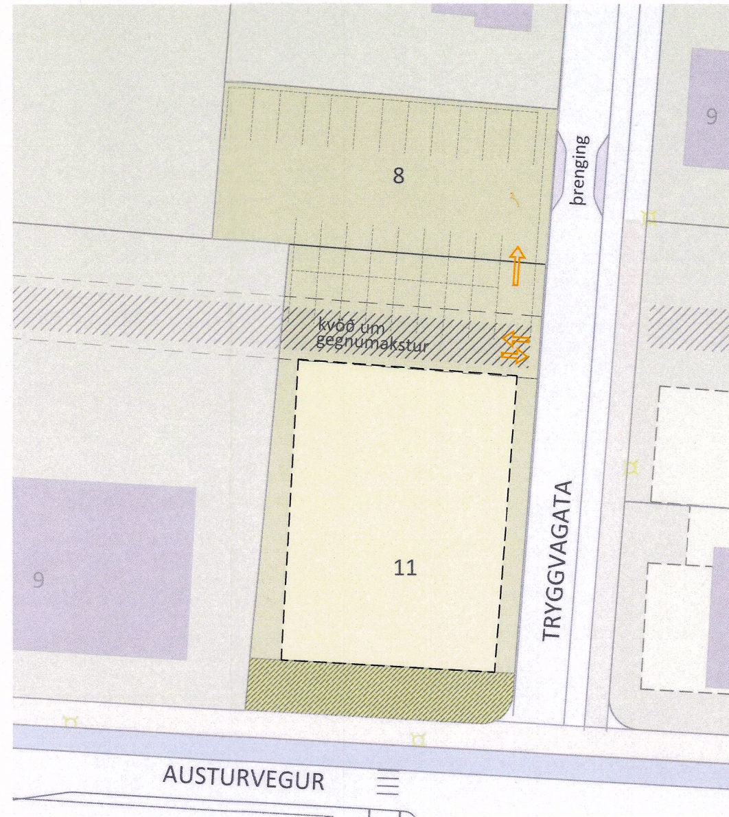
BREYTTUR DEILISKIPULAGSUPPDRAÐTUR 1:500