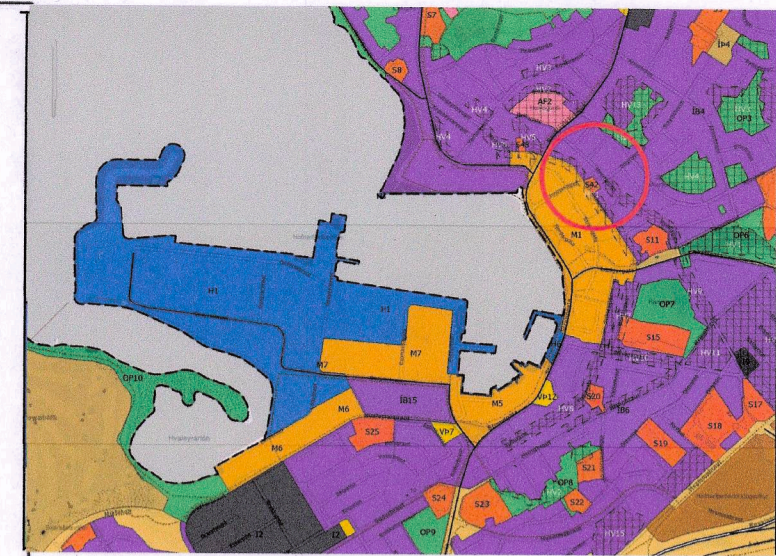
YFIRLITSMYND ÚR AÐALSKIPULAGI HAFNARFJARÐAR 2013 - 2025