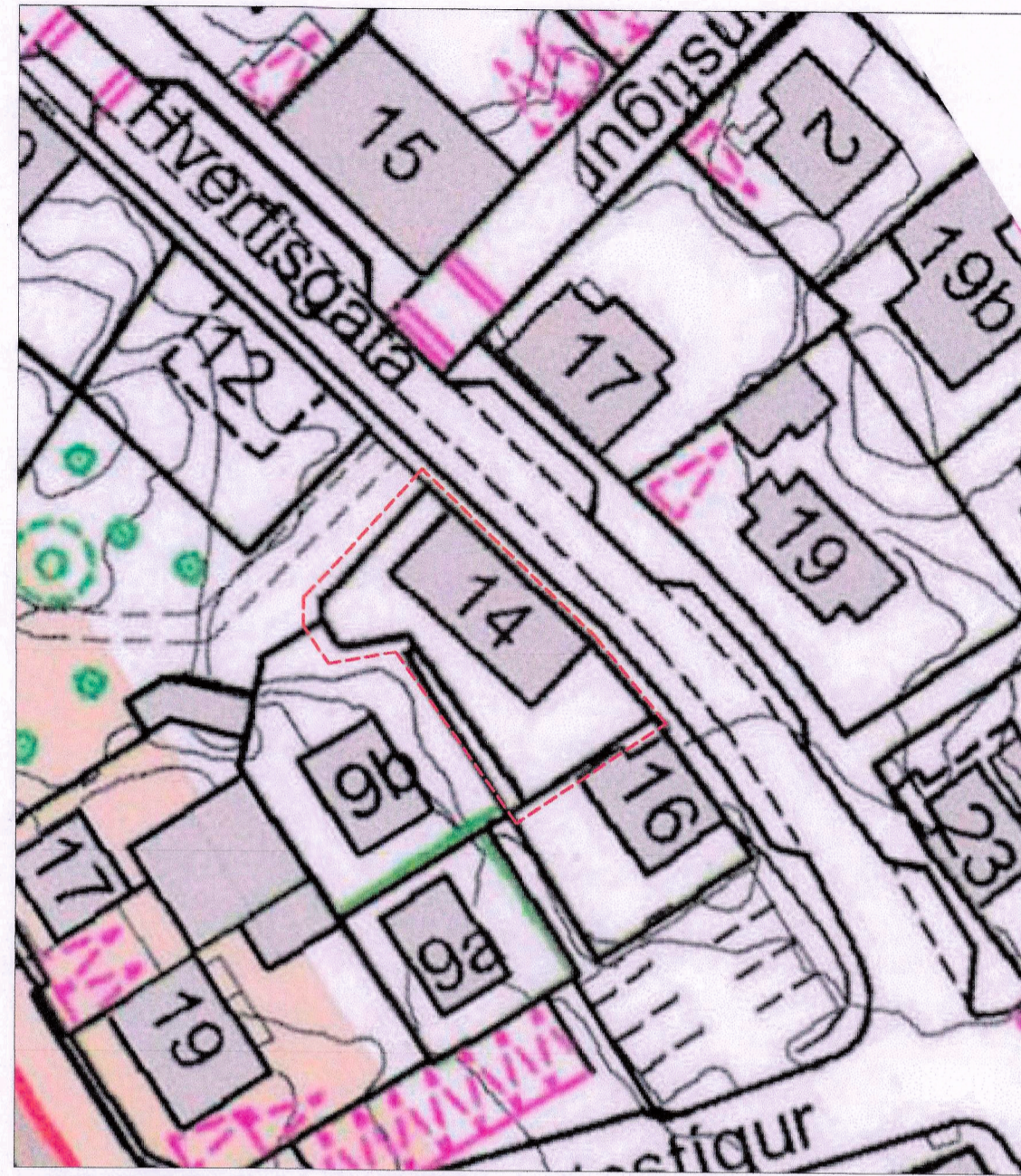
FYRIR BREYTINGU - Í GILDI FRÁ 12.3.2019