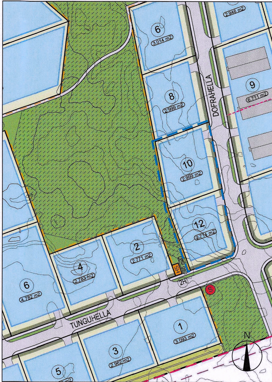
Hluti af gildandi deiliskipulagi Hellnahraun 3. áfangi, samþykkt í bæjarstjórn 26. júní 2007 m.s.br.