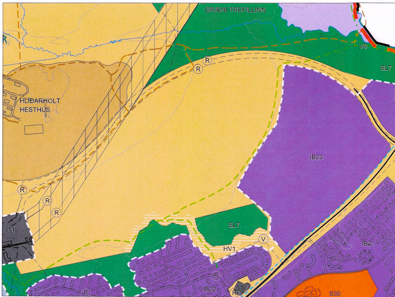
GILDANDI AÐALSKIPULAG, ÖÐLAÐIST GILDI 14.05.2018, M.S.BR.